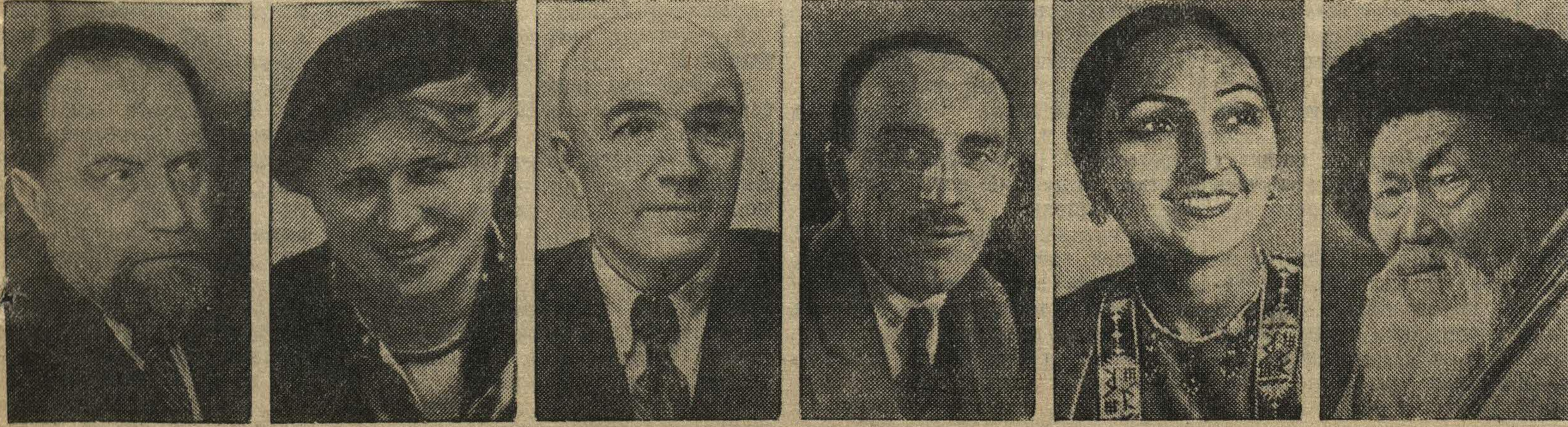
Слева направо: композитор Н. Я. Мясновский, артистка А. Н. Тарасова, академик И. М. Виноградов, академик Н. Н. Семенов, артистка Тамара Ханум, народный поэт Казахской ССР Джамбул Джабаев.