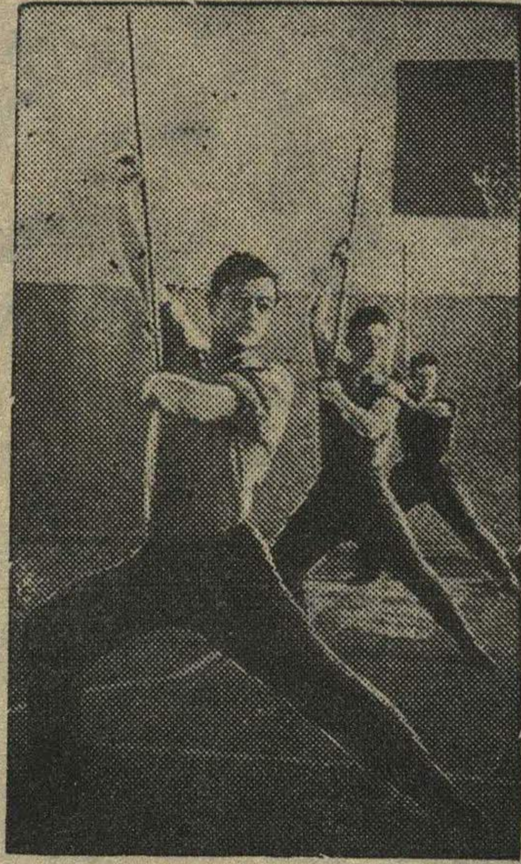
Гимнасты-студенты университета разучивают вольные движения.