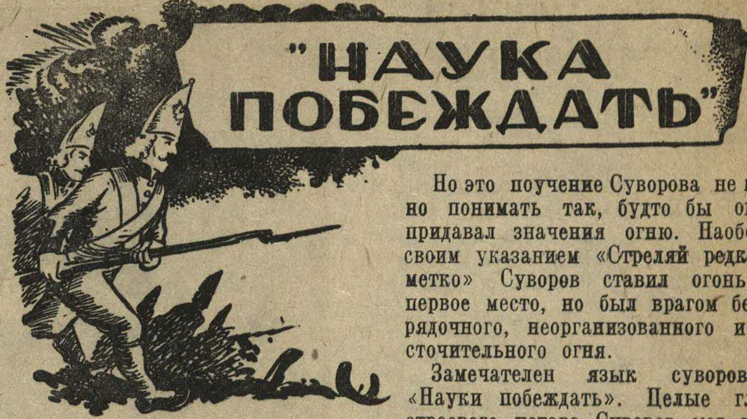
О военном искусстве А. В. Суворова

«Словесное поучение» проникнуто стремлением привить солдату чувство долга перед родиной и развить в нем необходимые для боя познания и навыки. «Солдату надлежит быть здорову, храбру, тверду, решиму, правдиву», — требует «Пучение».