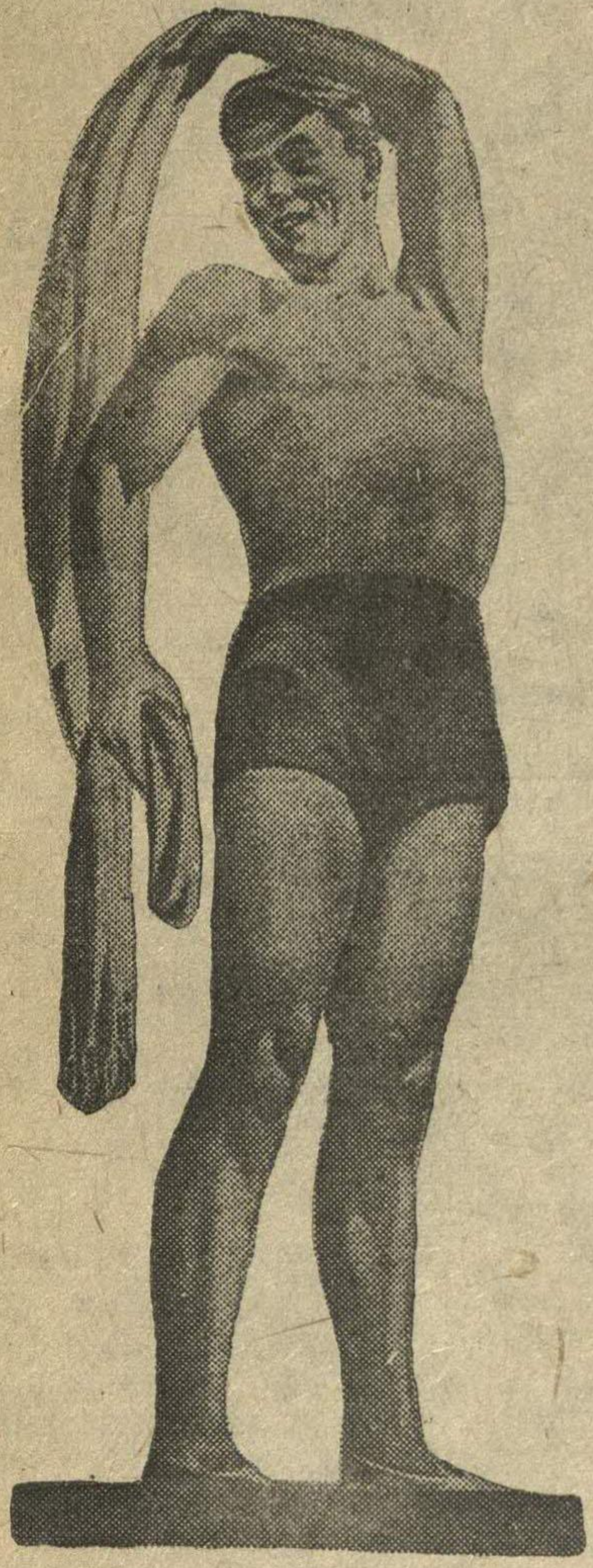
Не всегда турник и кольца Под рукой у комсомольца, Но проснувшись утром рано, От себя отбросив лень, Физкультурную зарядку Нужно делать каждый день!