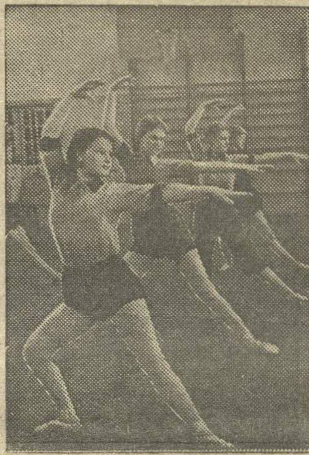
На уроке физкультуры в IV классе школы № 1 Автозаводского района.

У комсомольцев лесотехникума гимнастика уже вошла в быт. Свой рабочий день они начинают утренней зарядкой. После занятий разучивают упражнения под руководством физорга т. Клевачкина. Комсомольцы техникума соревнуются с комсомольцами Чернухинской средней школы.