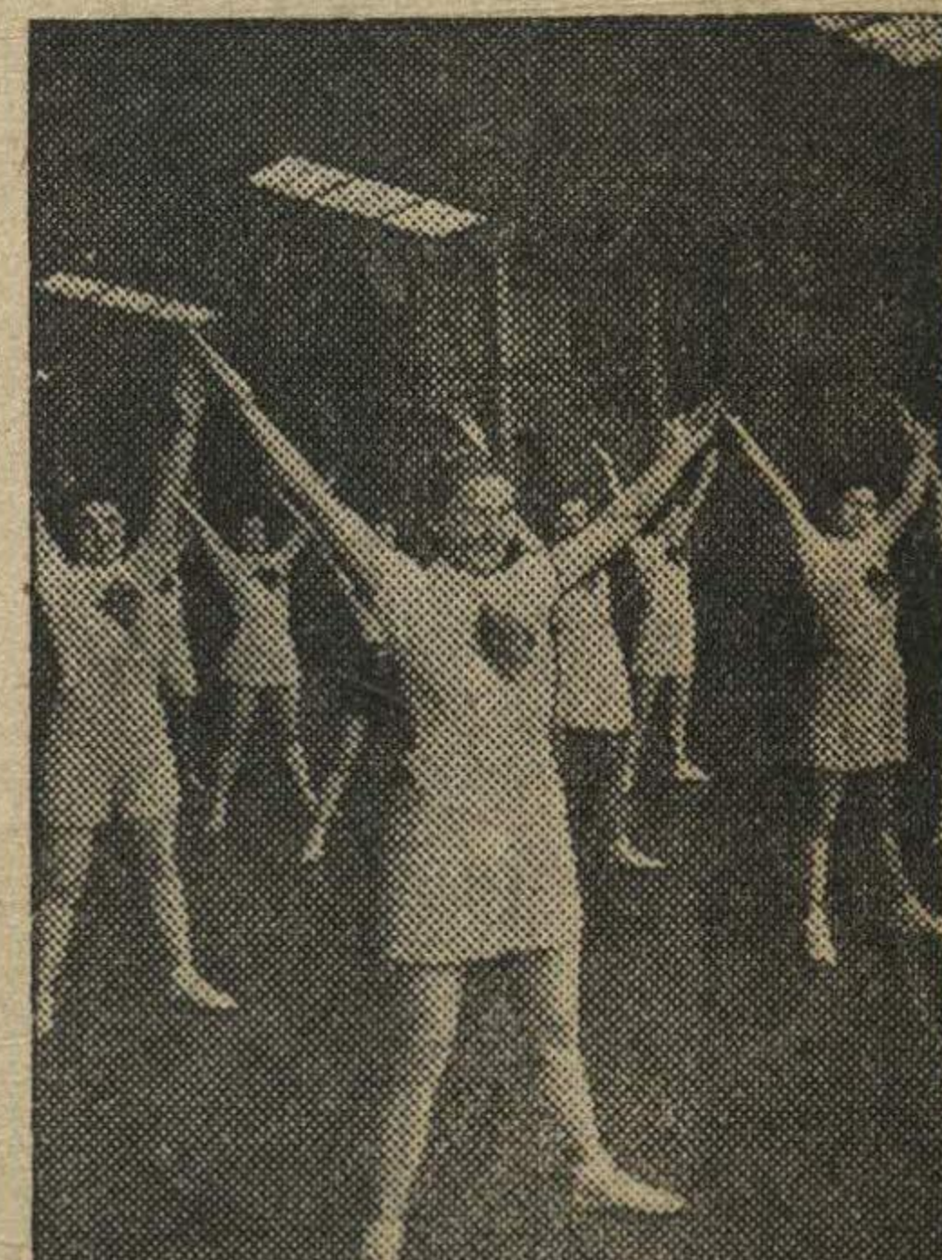
В Латвийской ССР. Физкультурники-работницы фабрики «Красный квадрат» выступают в Рижском Доме спорта.