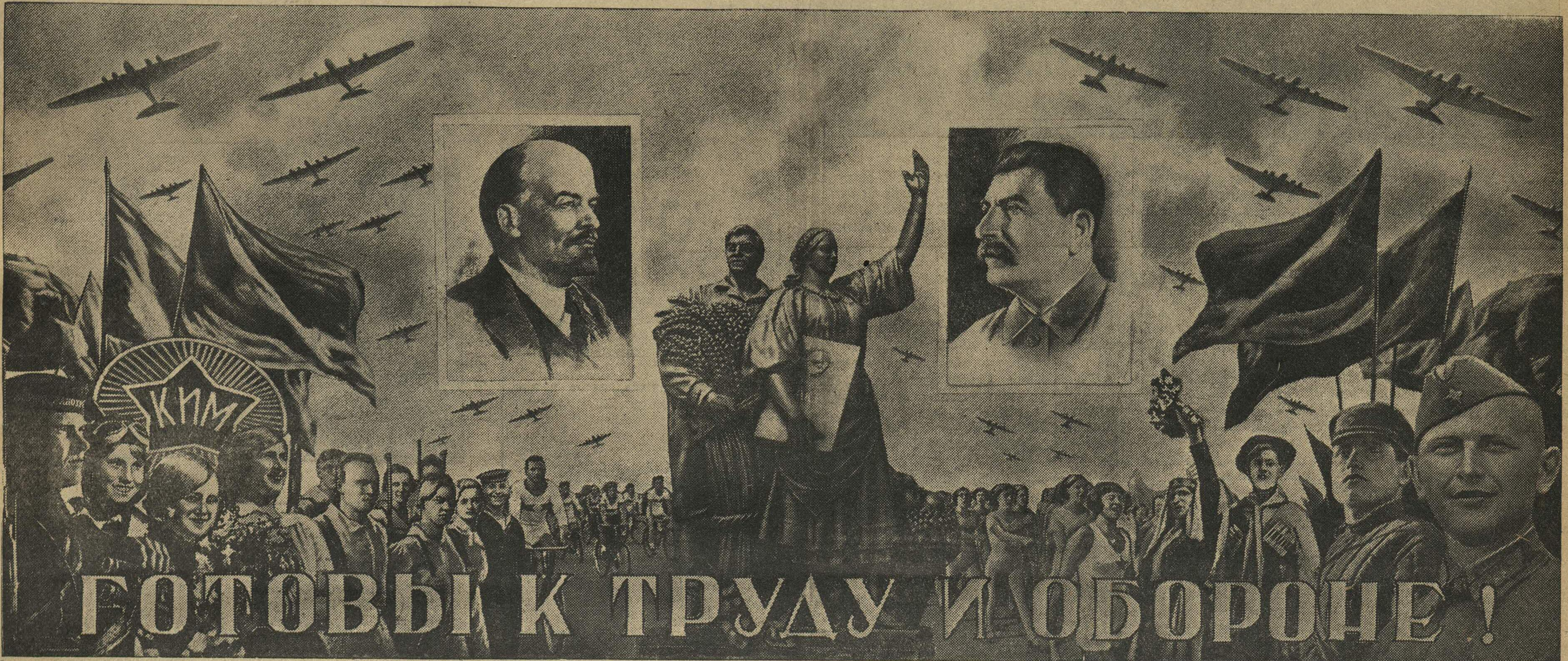
Монтаж Н. Головина.