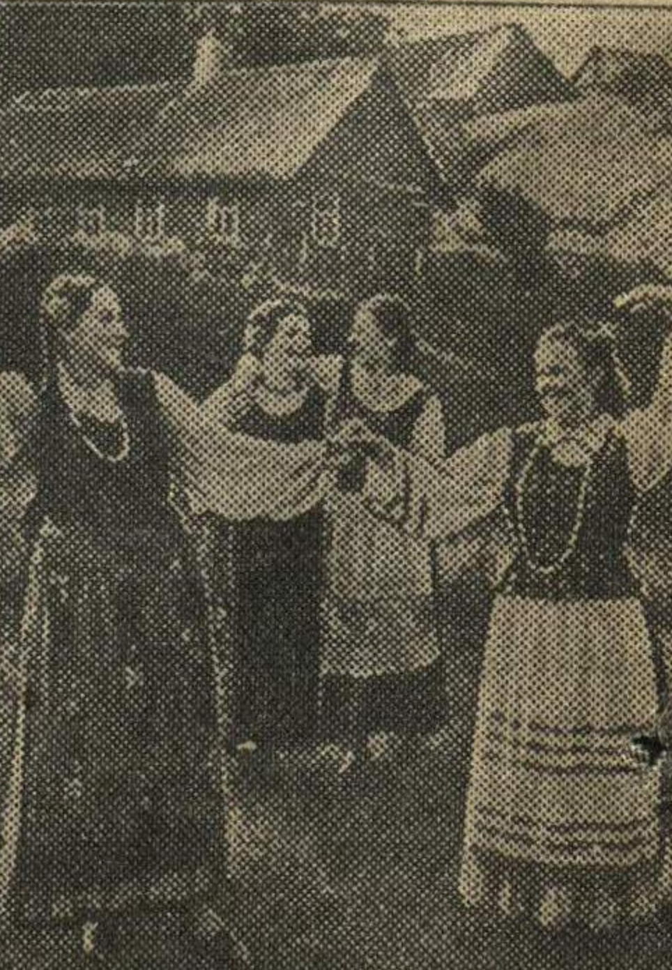
Крестьянки села Крони (Каунасский уезд) исполняют литовский народный танец.

Ф. БЕЛЯУСАС, секретарь ЦК ЛКСМ Литвы, депутат Верховного Совета СССР.