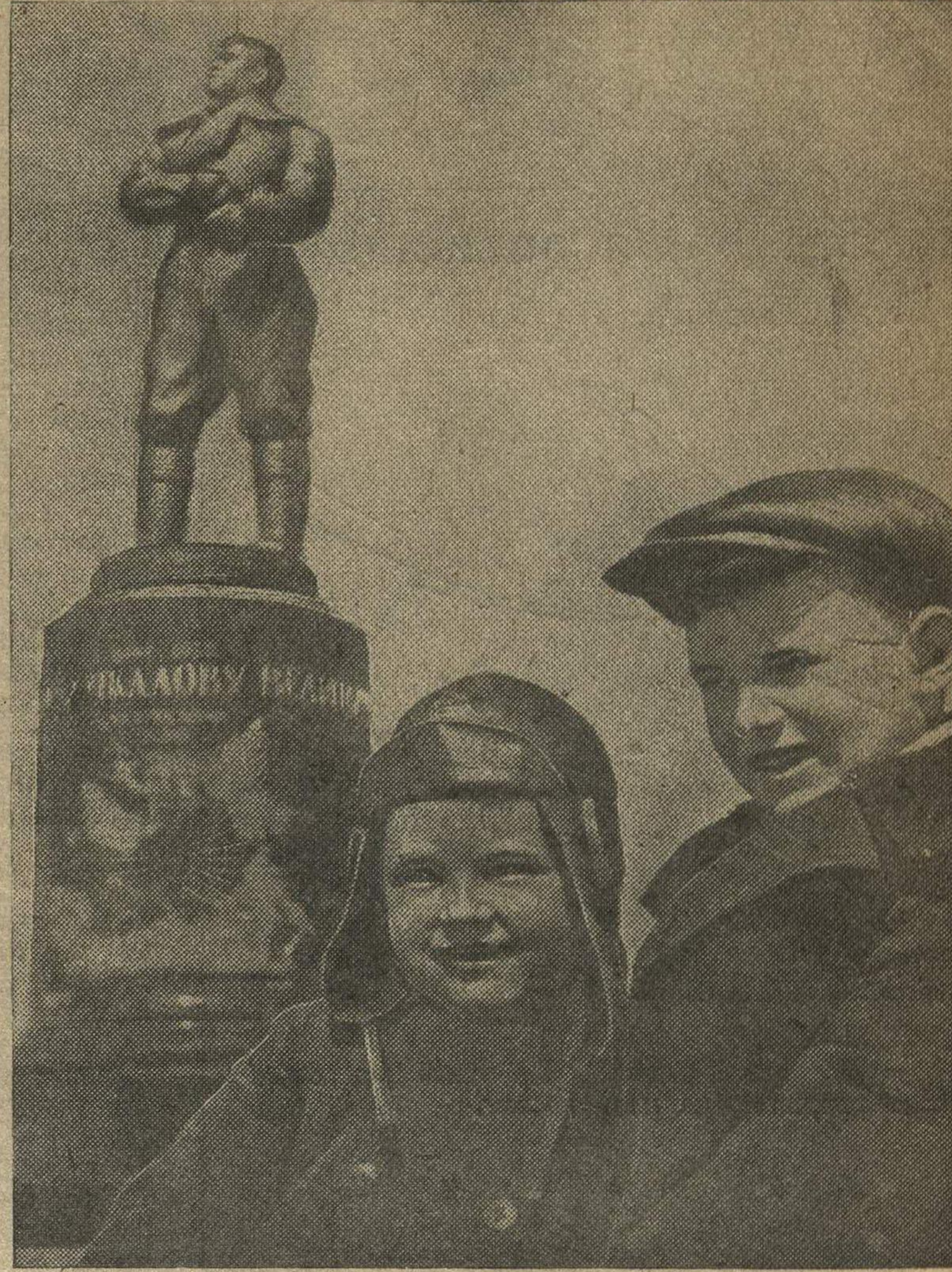
Будущие летчики.