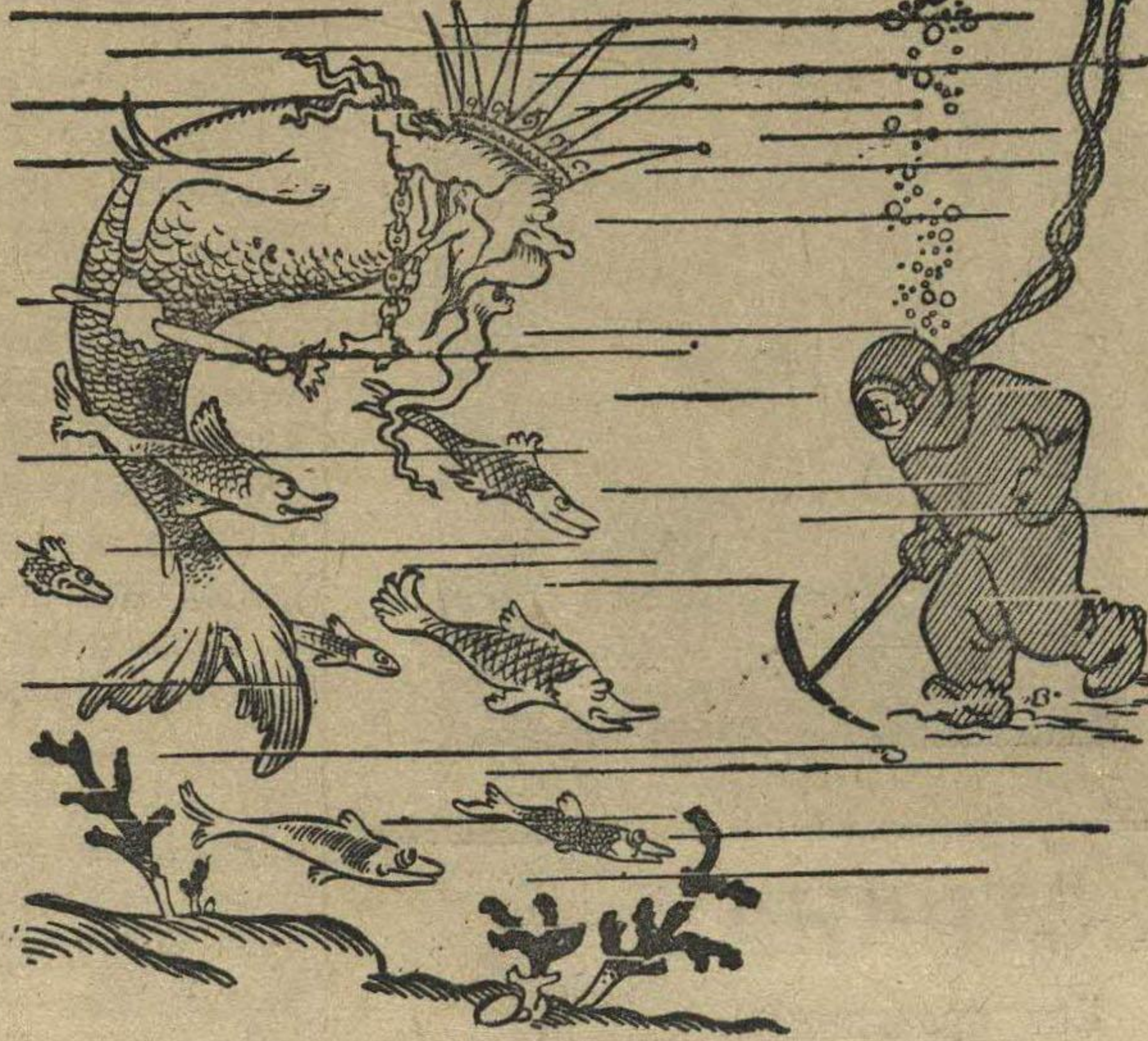
Царь водяной: Спасайся кто может — эпроновцы идут.