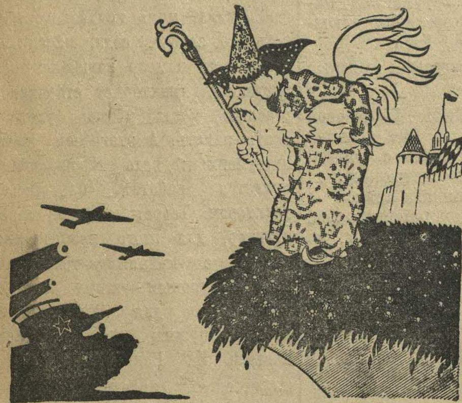
Звездочет: При такой охране границ им мой петушок совсем не нужен.