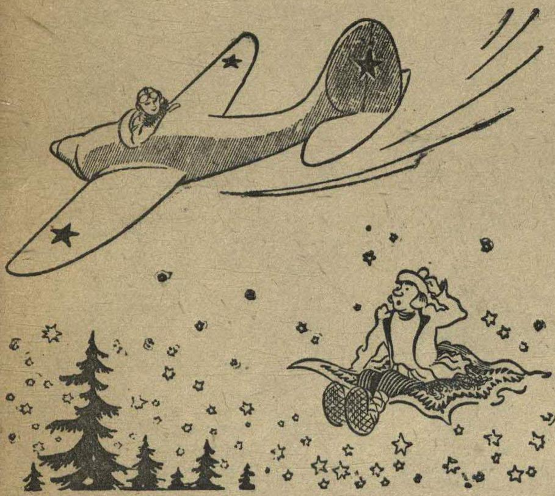
Рис. Н. Головина.

В том возрасте, когда мы знали Страх и таинственные сны, Нам дивной музыкой звучали Простые сказки старины. Нас наши бабушки и деды Вели дороною чудес. В земле сверкали самоцветы, Шумел видений полный лес, Мы на ковре на самолете Летели вдаль средь ярких звезд. У нас парович был в почете, И богатырь, и дед-Мороз. Нам в сказках тех встречались феи,