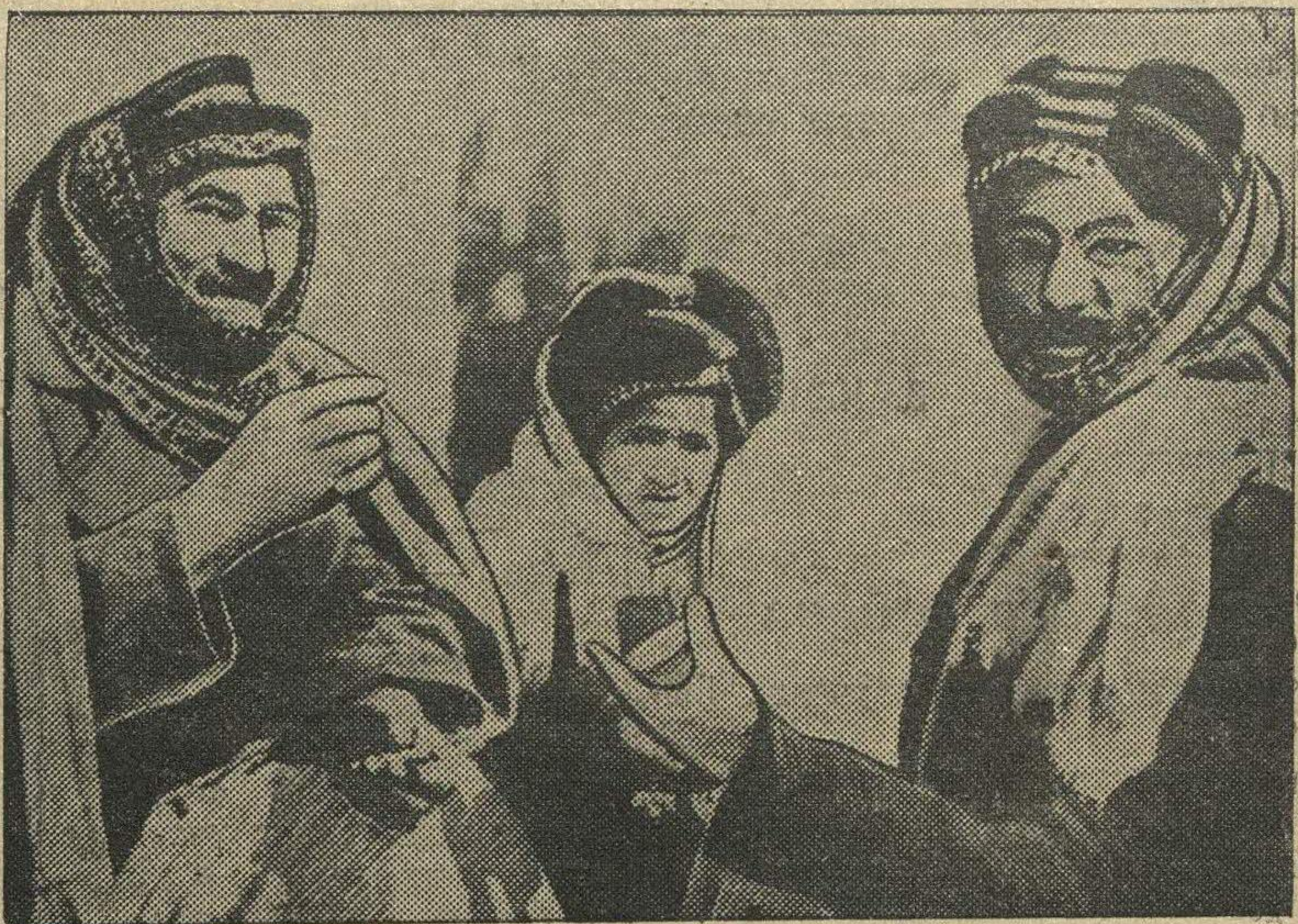
Вожди иранских племен.