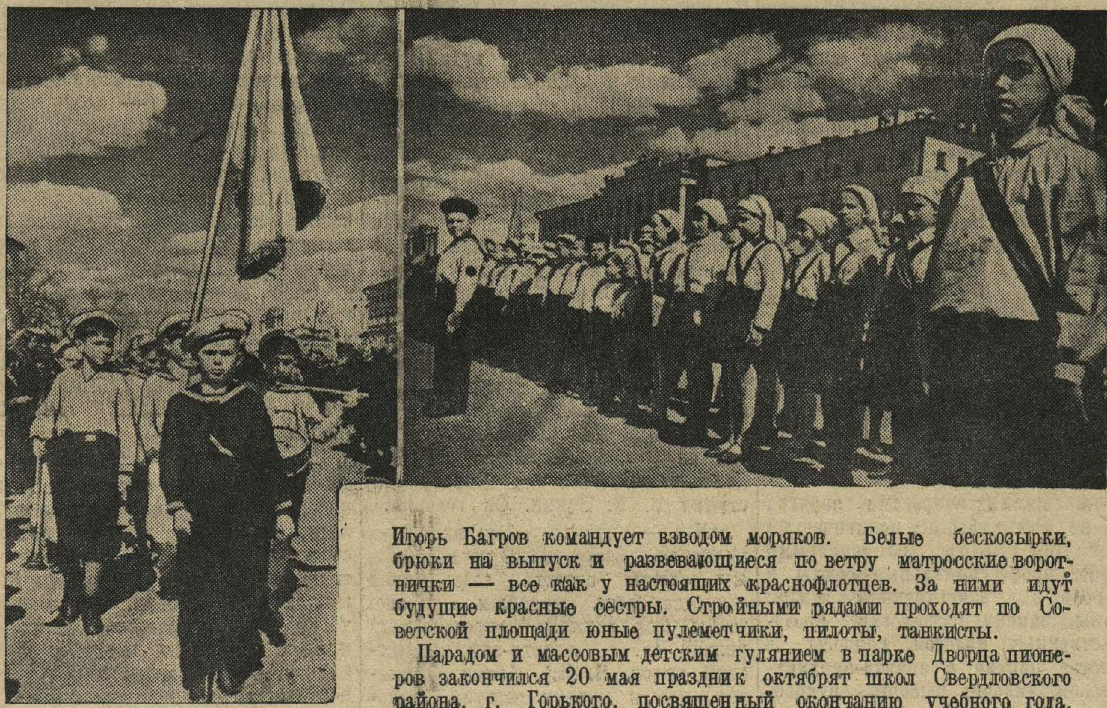
ИСПЫТАНИЯ В ШКОЛАХ

Этот год для советской школы был годом роста, дальнейшего выполнения решений X пленума ЦК ВЛКСМ. Комсомольцы школ неплохо поработали, остается достойно завершить учебный год.