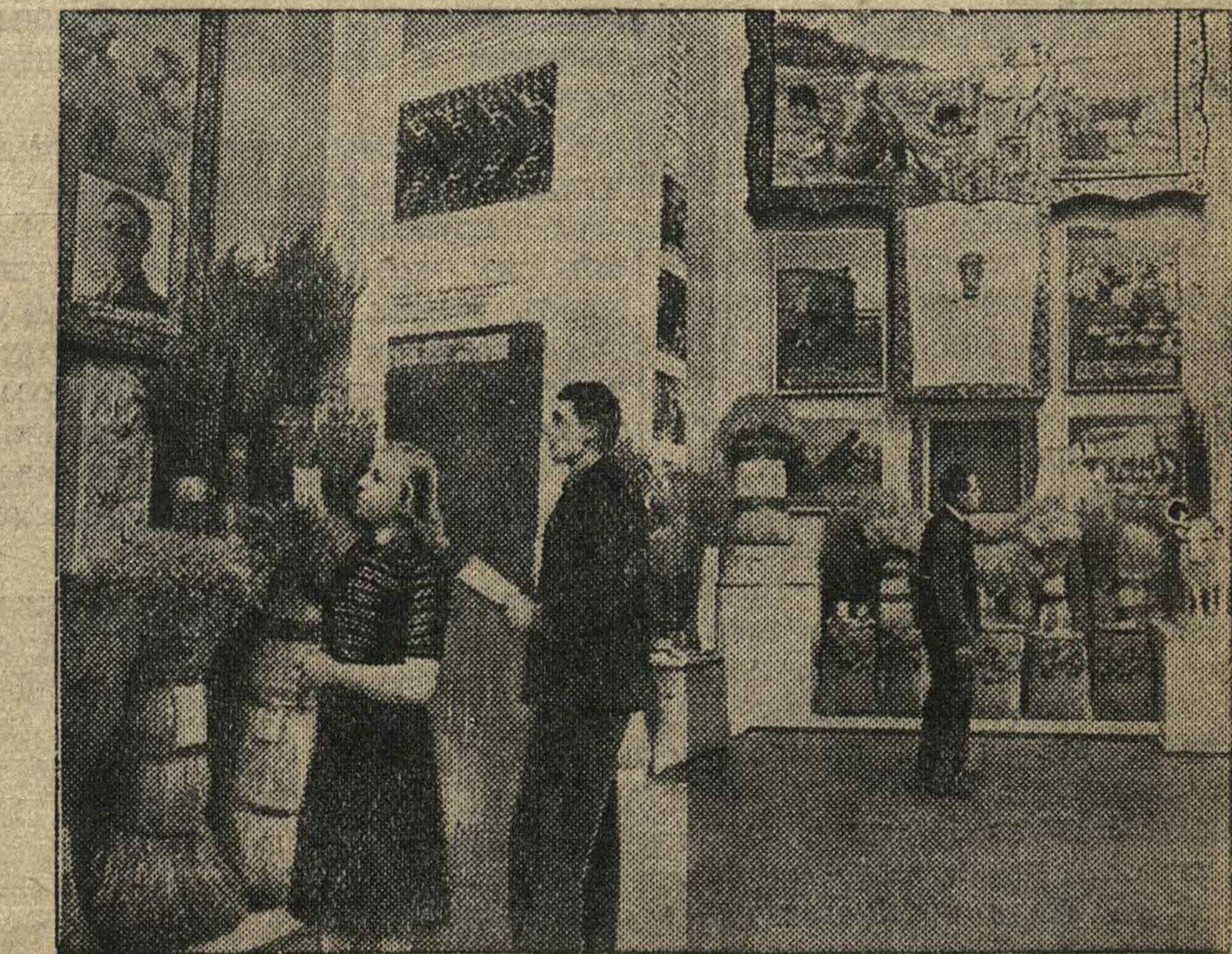
ВСЕСОЮЗНАЯ СЕЛЬСКОХОЗЯЙСТВЕННАЯ ВЫСТАВКА В МОСКВЕ. В зале Горьковской области павильона «Ленинград и Северо-Восток РСФСР».

Комитет вынес постановление о проведении 26 июля с. г. юбилейного заседания в г. Москве и о закладке в этот же день памятника Лермонтову в Москве и Ленинграде.