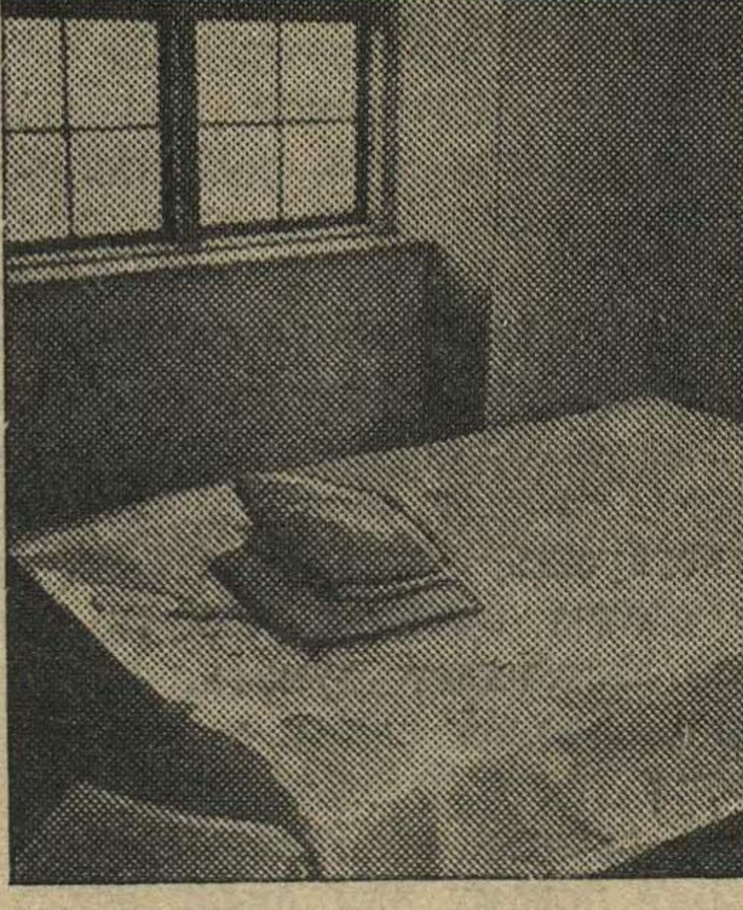
Домик Петра I в г. Таллине. Внизу — кровать Петра I в его домике.