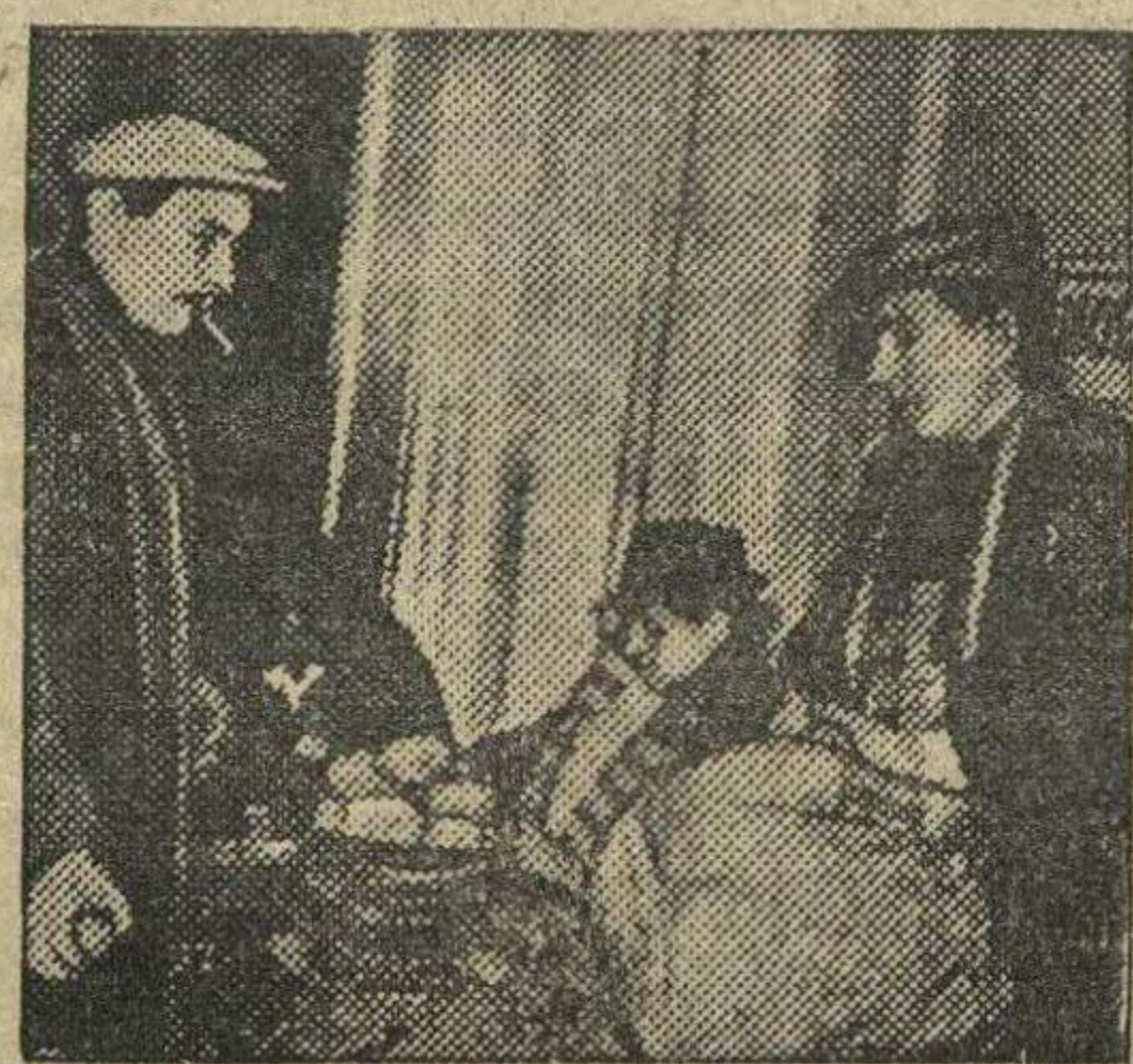
Парижские рабочие получают пак картофеля.

Коллективы школьников, занявшие первые места на всероссийских соревнованиях, получают переходящие призы и грамоты Наркомпроса РСФСР. Во всесоюзных соревнованиях по легкой атлетике и плаванию, которые состоятся в Днепропетровске в конце лета, примут участие лучшие школьные коллективы, занявшие первое место в соревнованиях на первенство РСФСР, и сборный коллектив, составленный из сильнейших юных спортсменов республики.