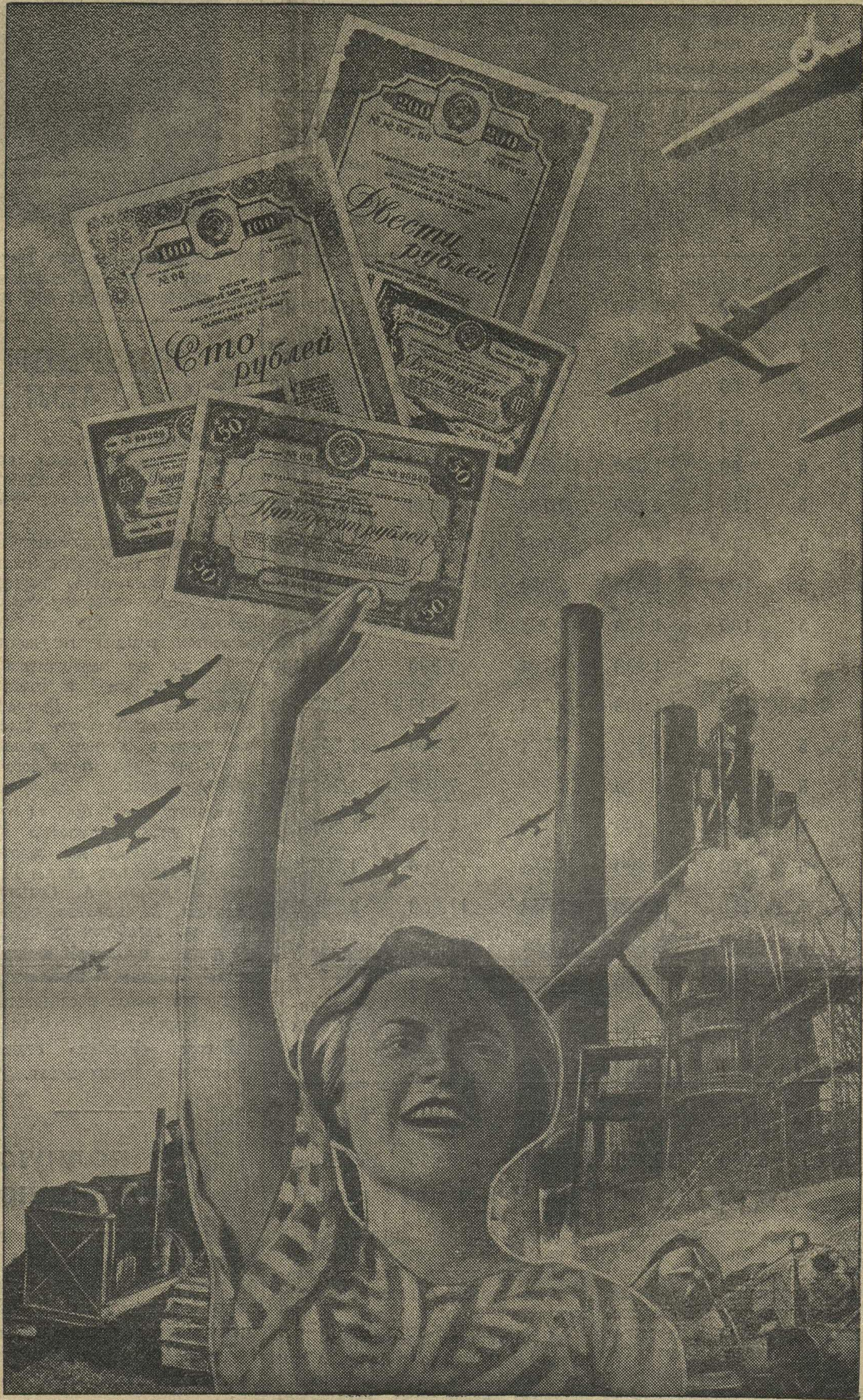
Фотомонтаж Н. Головина.