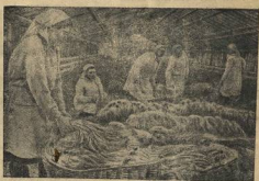
МОСКОВСКАЯ ОБЛАСТЬ. Союз имени 1-го мая, Балтийского района, крупный колк снабжает трудящихся свежими овощами.

Совещание редакторов стеновых газет по обмену опытом работы.