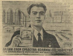
ДАЛИМ СВОИ СРЕДСТВА ВЗАЙМЫ ГОСУДАРСТВУ ДЛЯ ДАЛЬНЕЙШЕГО УПРОЧНЕНИЯ МОЩНОСТИ НАШЕГО СТРАНЫ

Шахт художника В. Коренько, выигравший Гоффинизатор.