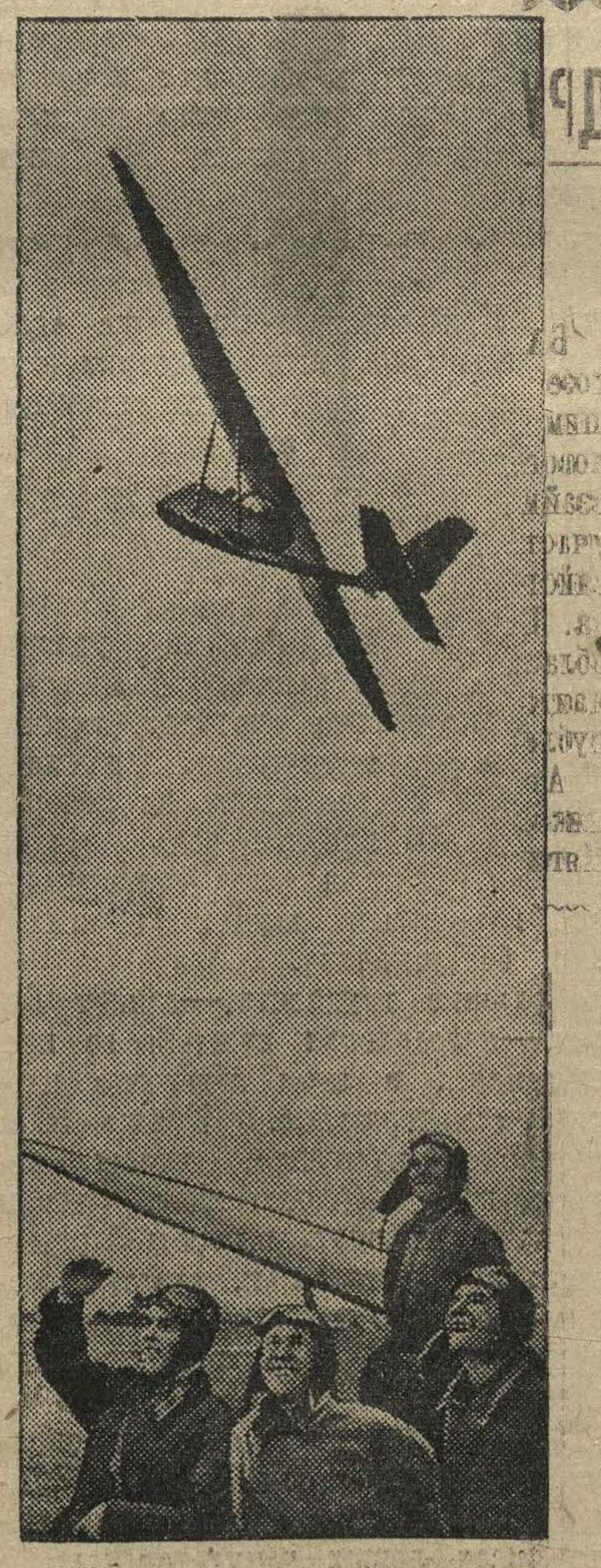
Группа курсантов Московского планерного клуба на аэродроме.

Вечером в Центральном аэроклубе СССР им. В. П. Чкалова было получено сообщение о том, что «Рот-Фронт-7», управляемый тов. М. Романовым, совершил посадку близ села Кушня, Шацкого района, Рязанской области. М. Романов летел в весьма сложной обстановке, не благоприятствовавшей парашюту полету. И все же ему удалось мастерски пройти без посадки по прямой 335 километров. (ТАСС).