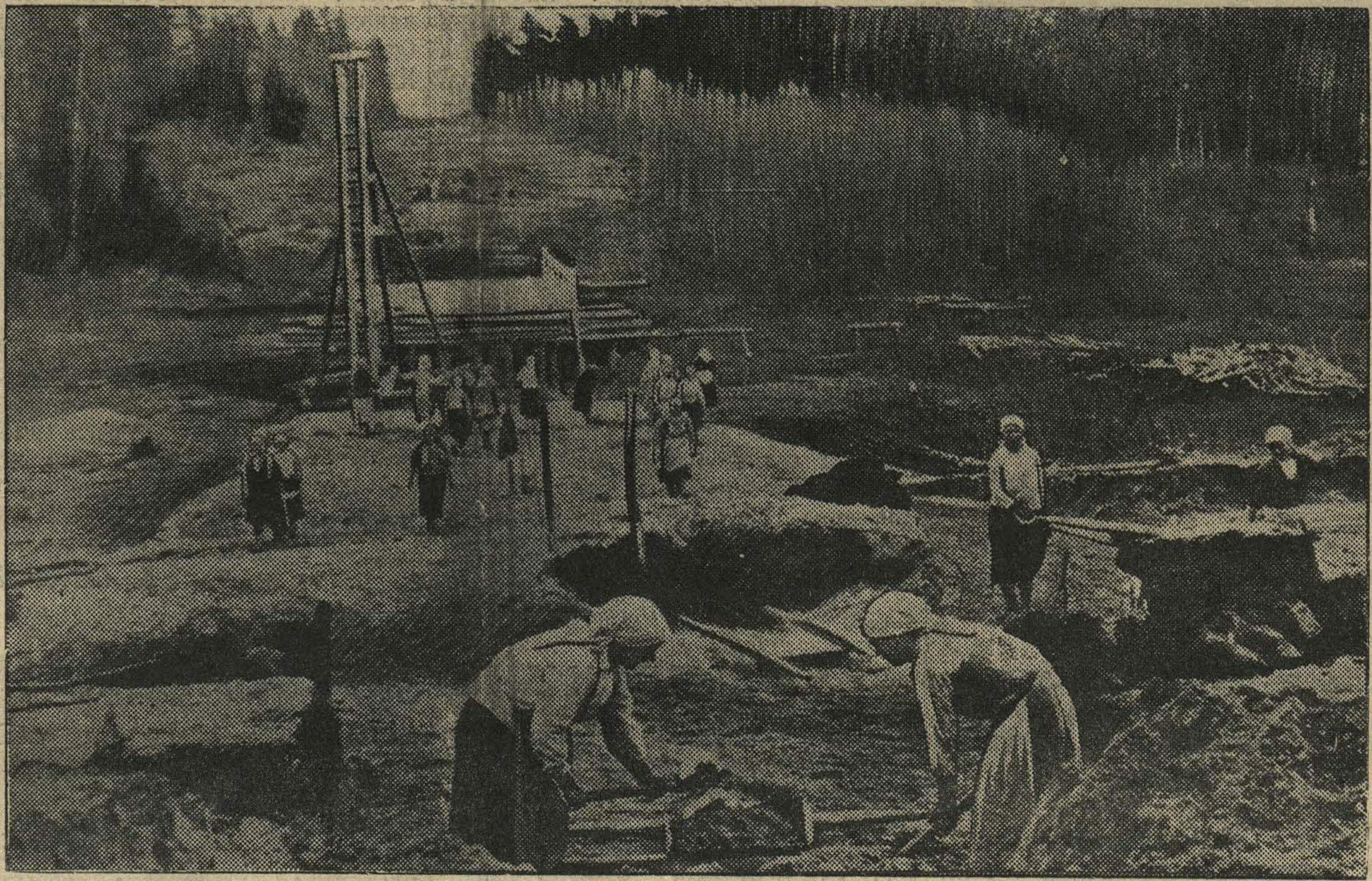
На строительстве дороги Горький—Арзамас—Кулебаки. На участке колхоза имени XVIII-го партс'зда Чернухинского района.

Положение о профсоюзно-комсомольском кроссе см. на 4-й стр.