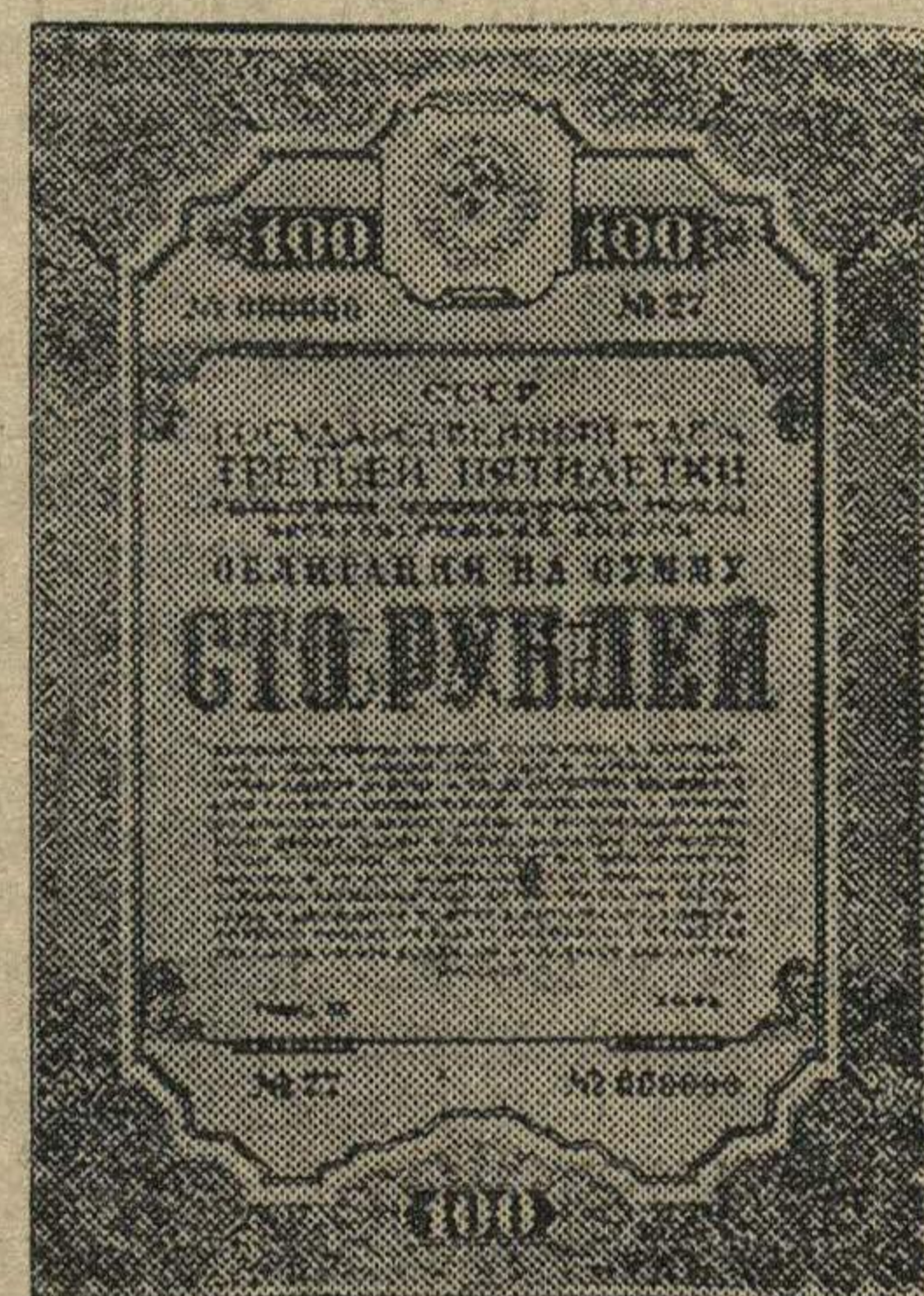
Образец 100-рублевой облигации государственного Займа Третьей Пятилетки (выпуск четвертого года).

Агитаторы рассказывают колхозникам о значении Займа Третьей Пятилетки (выпуск четвертого года).