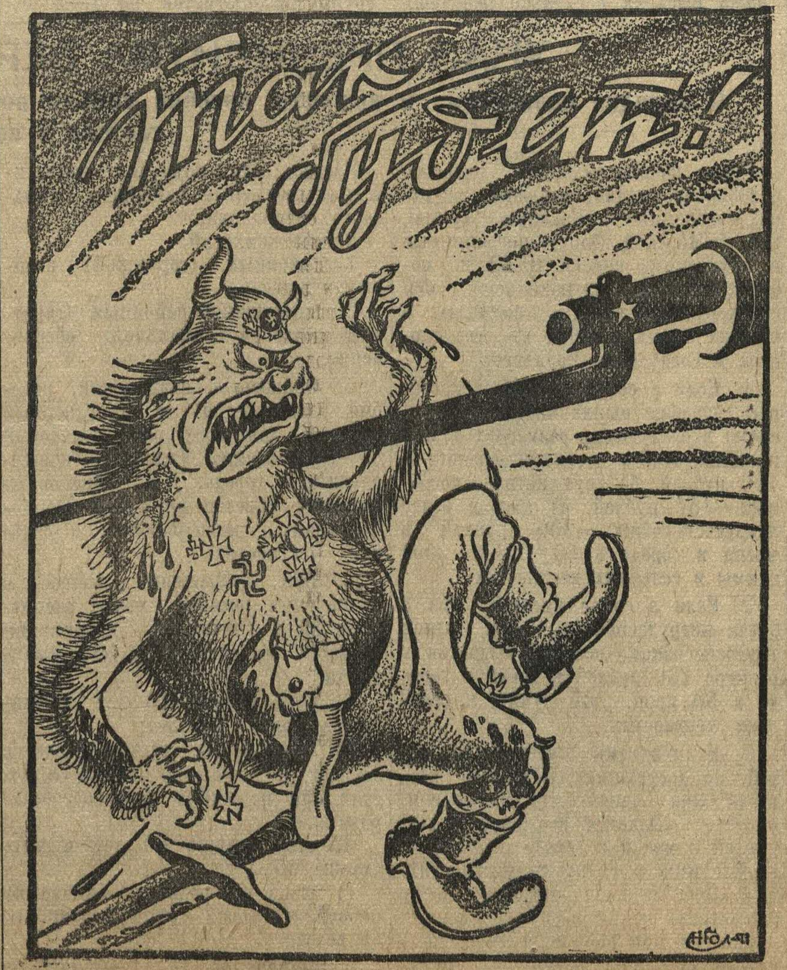
Рисунок Н. Головина.