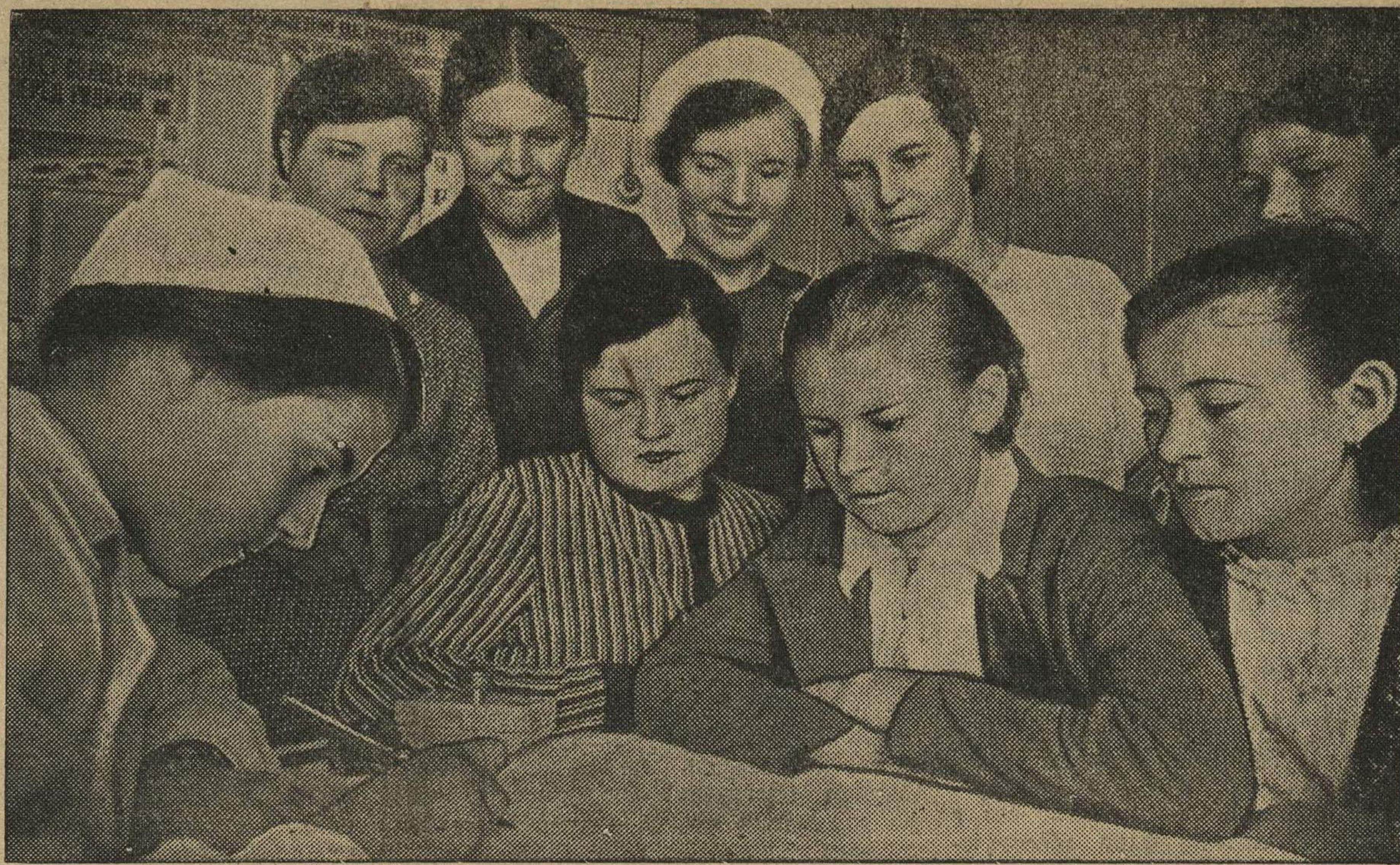
В ответ на призыв о помощи нашей родине 70 работниц цеха № 14 завода им. Ленина записываются донорами. На снимке: группа комсомолок цеха № 14 записываются донорами на пункте переливания крови.