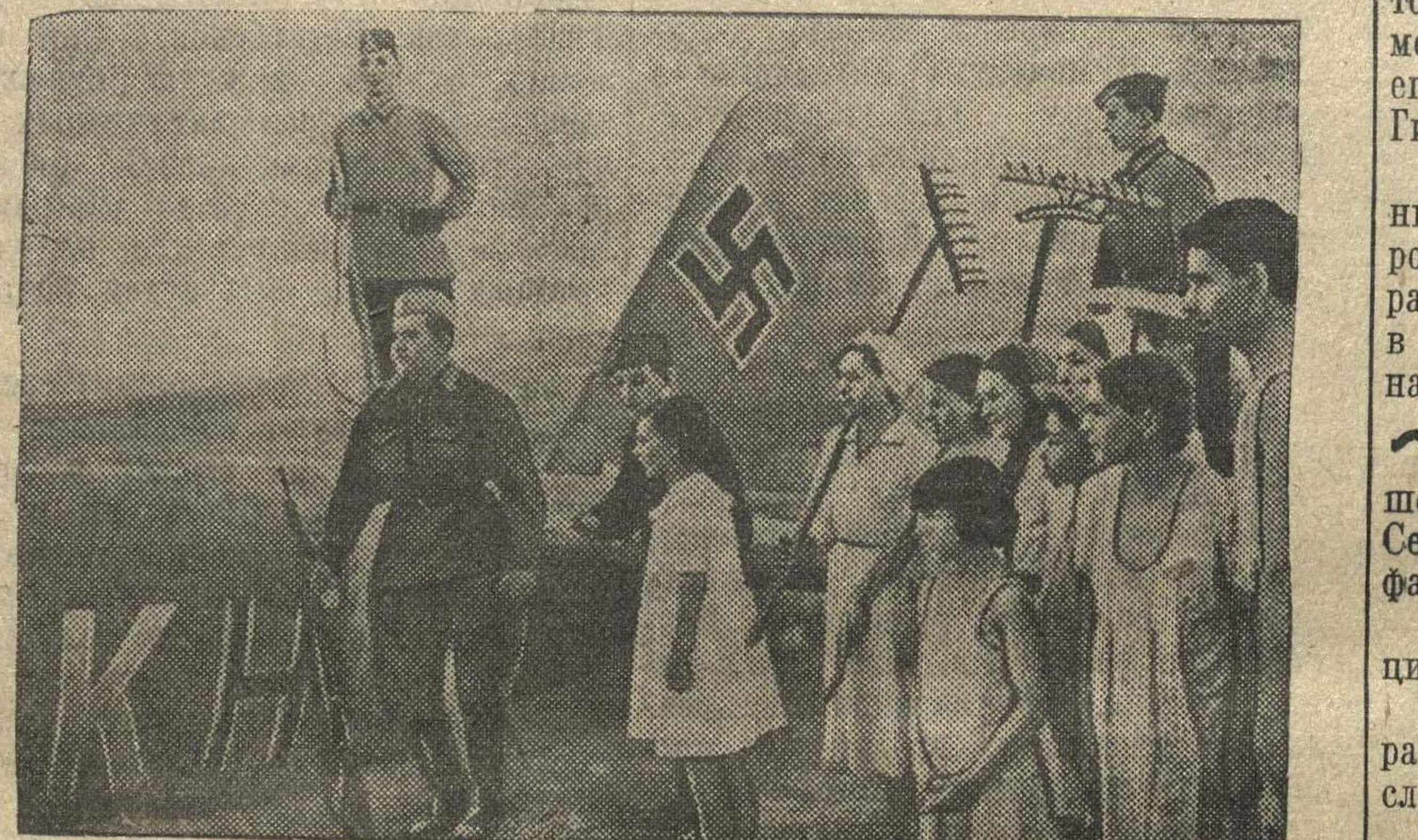
Действующая Красная Армия. Фашистский самолет, сбитый отважными советскими летчиками.

Если австрийцы, «славянские ме- тисы» — «сброд» и их нужно раз- давить, то легко себе представить, как относится Гитлер к «чистым» славянам. Это что-то необобразно дикое и чудовищное. Изверг Гитлер изрекает: «Немцы — раса, славяне — масса рабов. Нужно, чтобы иерар- хия господ поработила массу рабов». Гитлер приходит в озлобление и бе- шеный раж, видя, что Европа на- селена многочисленными массами славянских народов, и делает вывод: «Нужно истреблять славян, сокра- щать рождаемость населения в славя- нских государствах. «Нужно оста- новить всеми средствами плодот- вивость славян». Но «главная цель — уничтожить массы славян». Славя- нство — чуждое население, а посему, заявляет Гитлер, «Перед нами встает