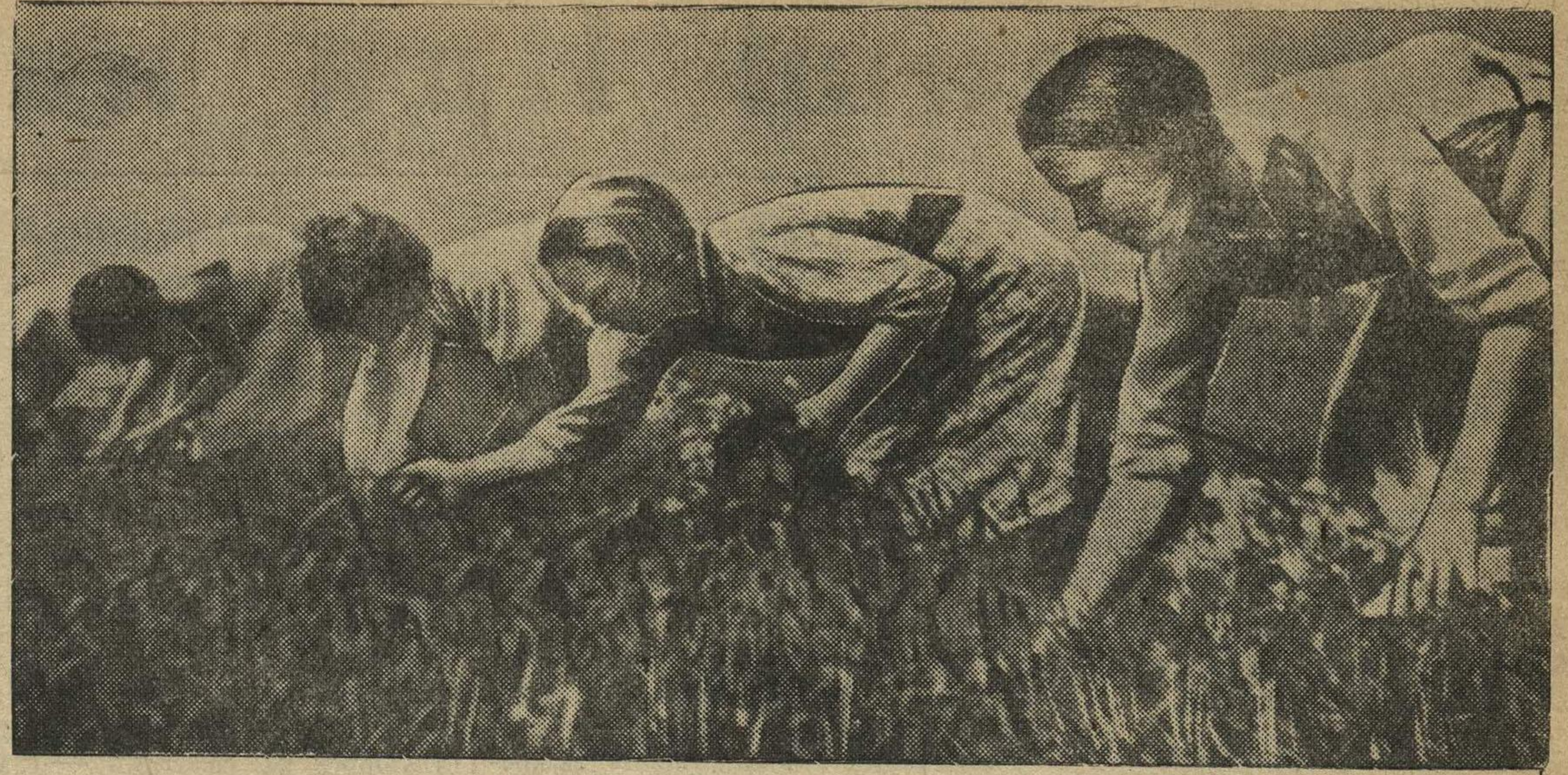
Пионеры школы № 44 Чкаловского района г. Дзержинска в Доскинском совхозе на прополке овса.