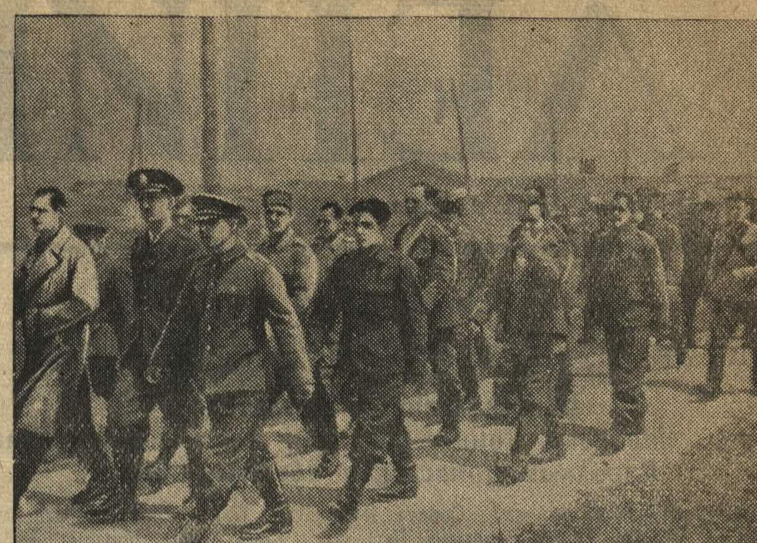
Действующая Красная Армия. Пленные немецкие офицеры и солдаты. (съемка специальных корреспондентов Союзкинохроники).