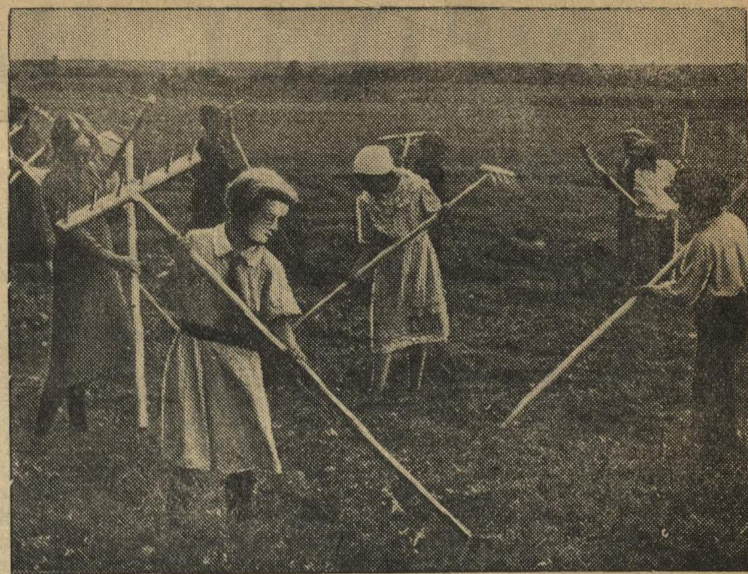
Пионеры колхоза им. Орджоникидзе (Лысковский район) помогают колхозникам на сеноуборке.

Ребята поставили на выгрузку лесоматериалов. Они успешно справляются со своими обязанностями.