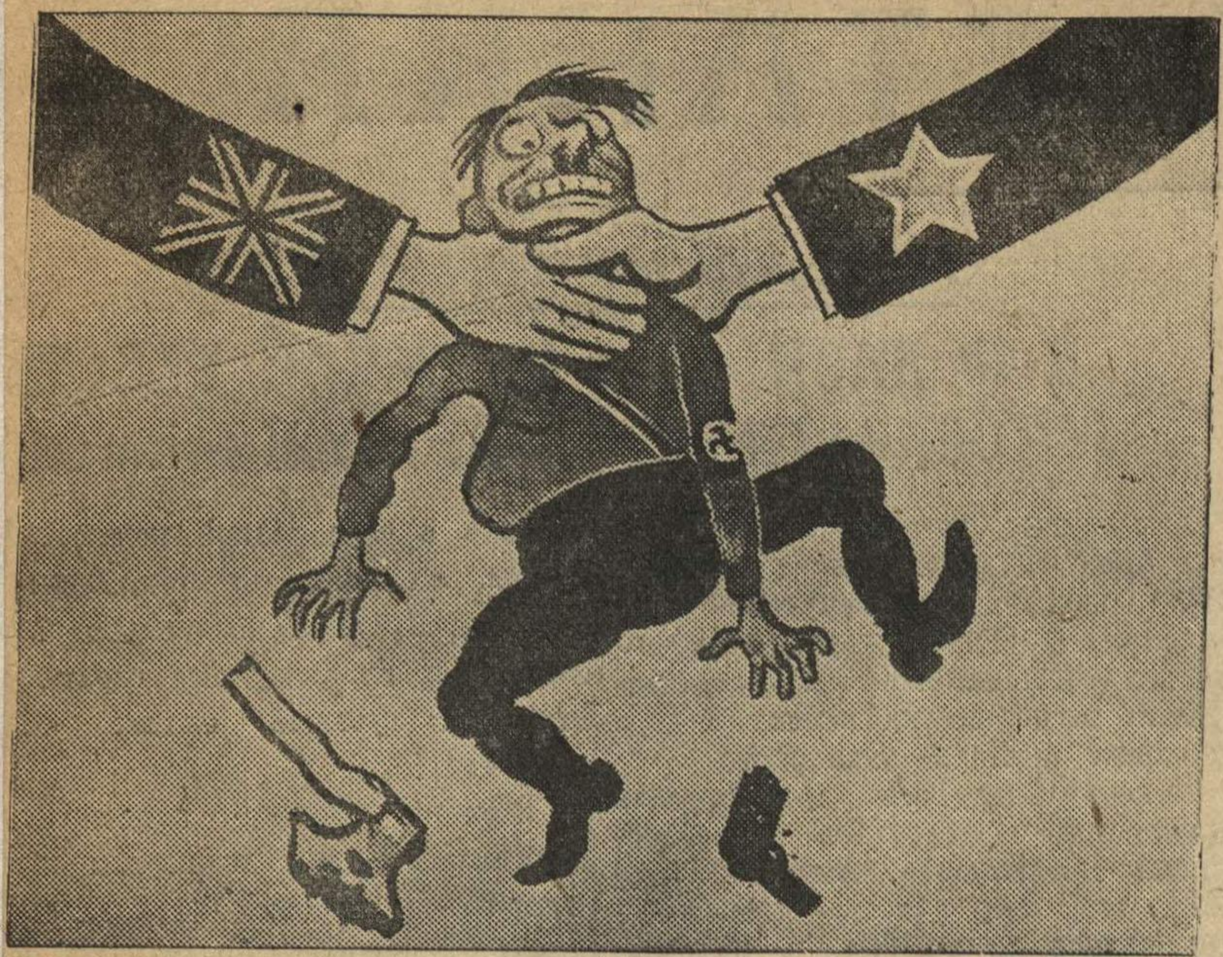
Две крепкие, как сталь, руки Друг к другу братски мы протерли.