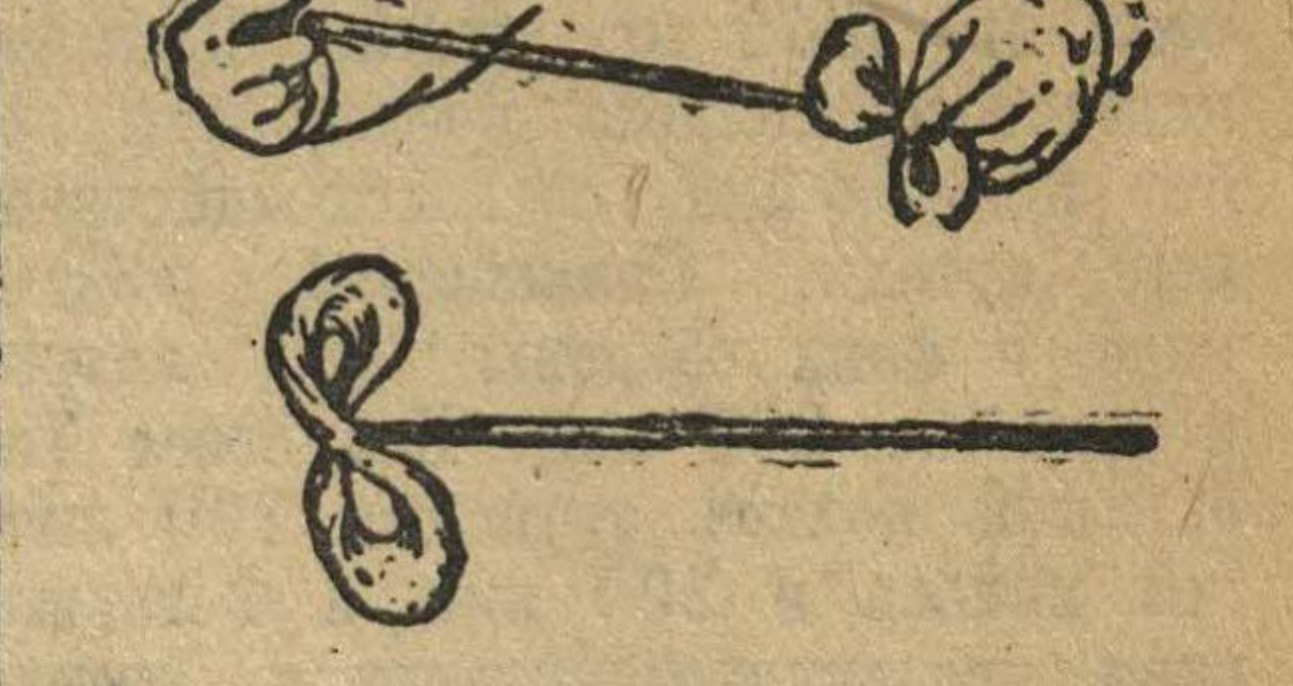
Как наложить паклю на протирку.

мет, взять левой рукой за переднюю часть ветоши, продвигать шомпол по всей длине канала 7—10 раз. Переменяя паклю или ветошь, повторяют действие 2—3 раза;