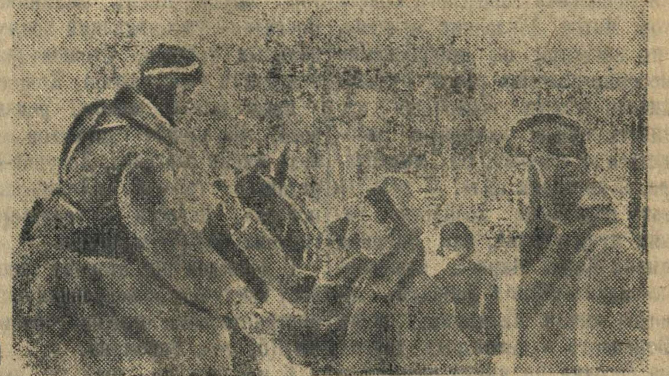
На снимке: Жители освобожденного города радостно встречают своих освободителей — воинов Красной Армии.