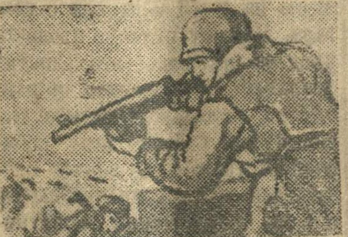
Гордится сын родным отцом, Отец гордится славным сыном. Страна обоним горда— Героем сельского труда И фронтовым бойцом-героем— И воздает им честь обоним: — Привет отцам и сыновьям! Вперед к решающим боям! Окно ТАСС № 692. Рисунок худ. В. Айвазяна. Текст Демьяна Бедного.