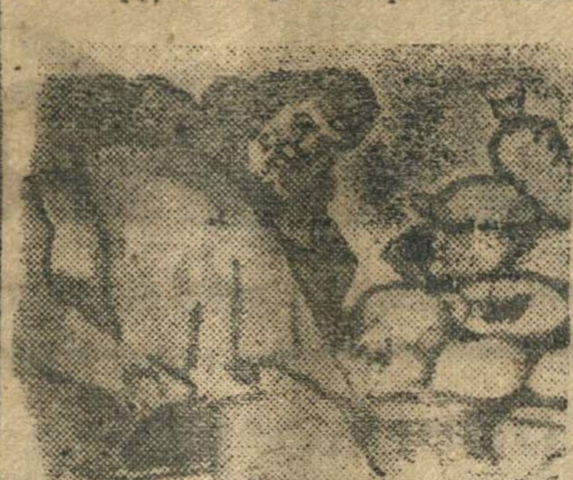
Колхозник доблестный, отец Зерном обильно фронт снебжает. Сын старика герой—боец В боях врагов уничтожает. Зерно на фронте со свином Сомкнулись в пиданге едином!