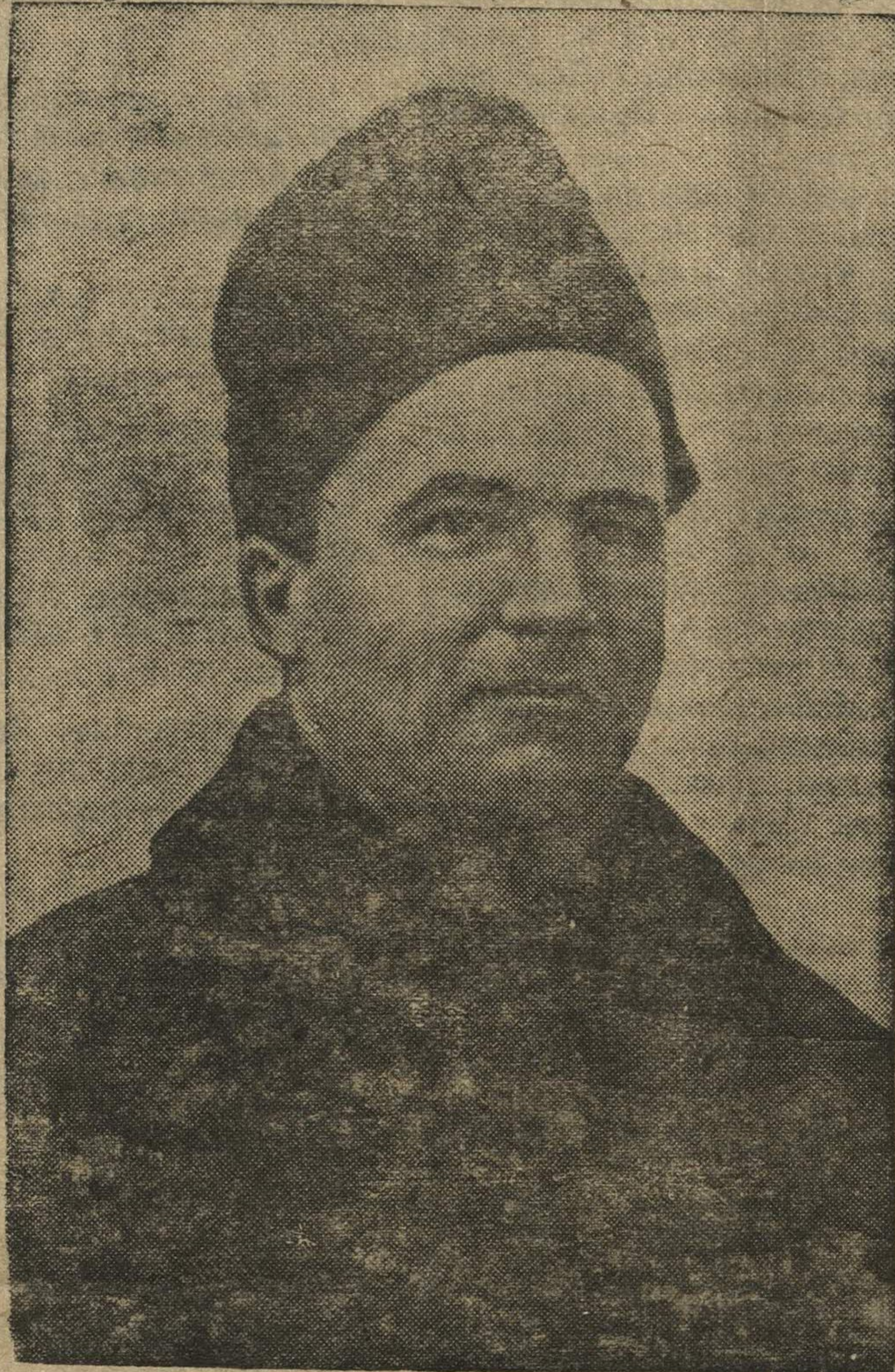
Сергей Миронович КИРОВ