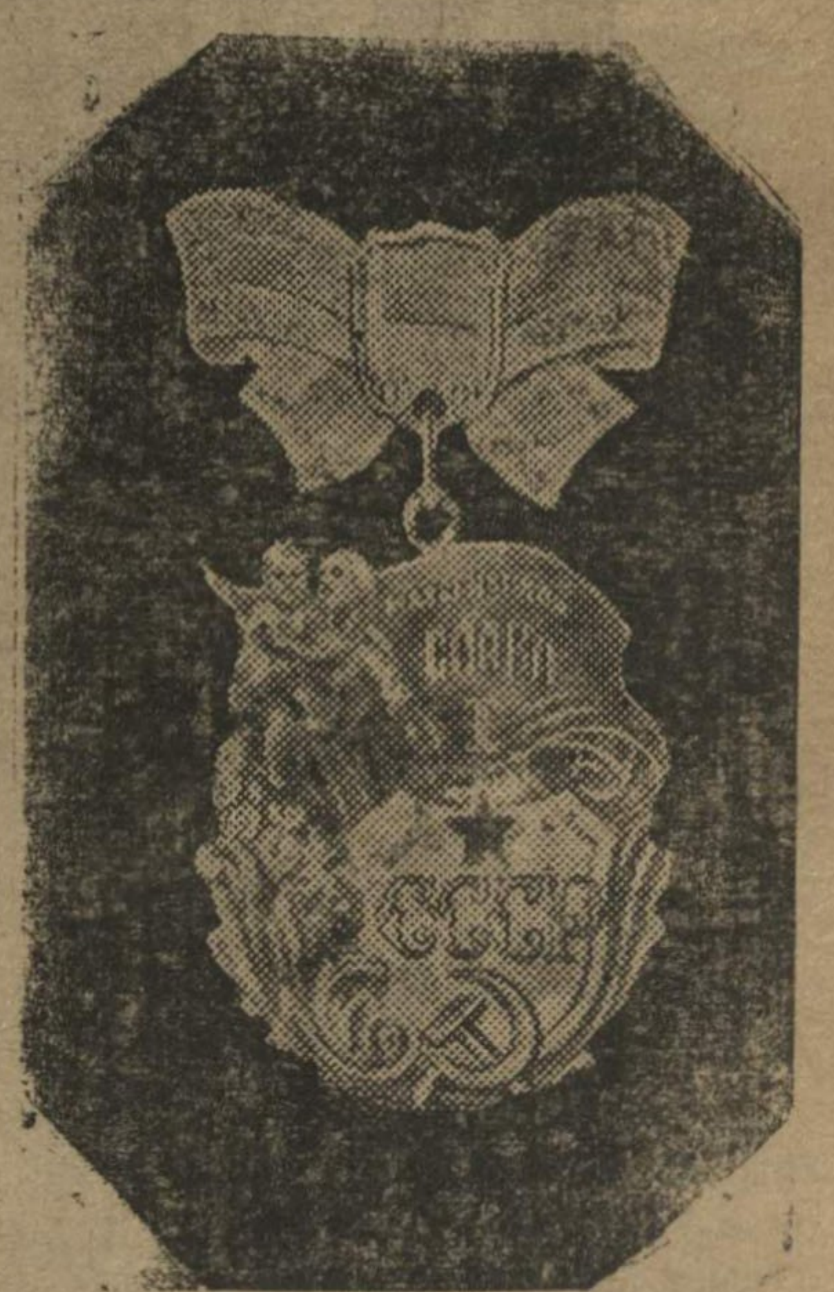
Орден «Материнская слава» I степени