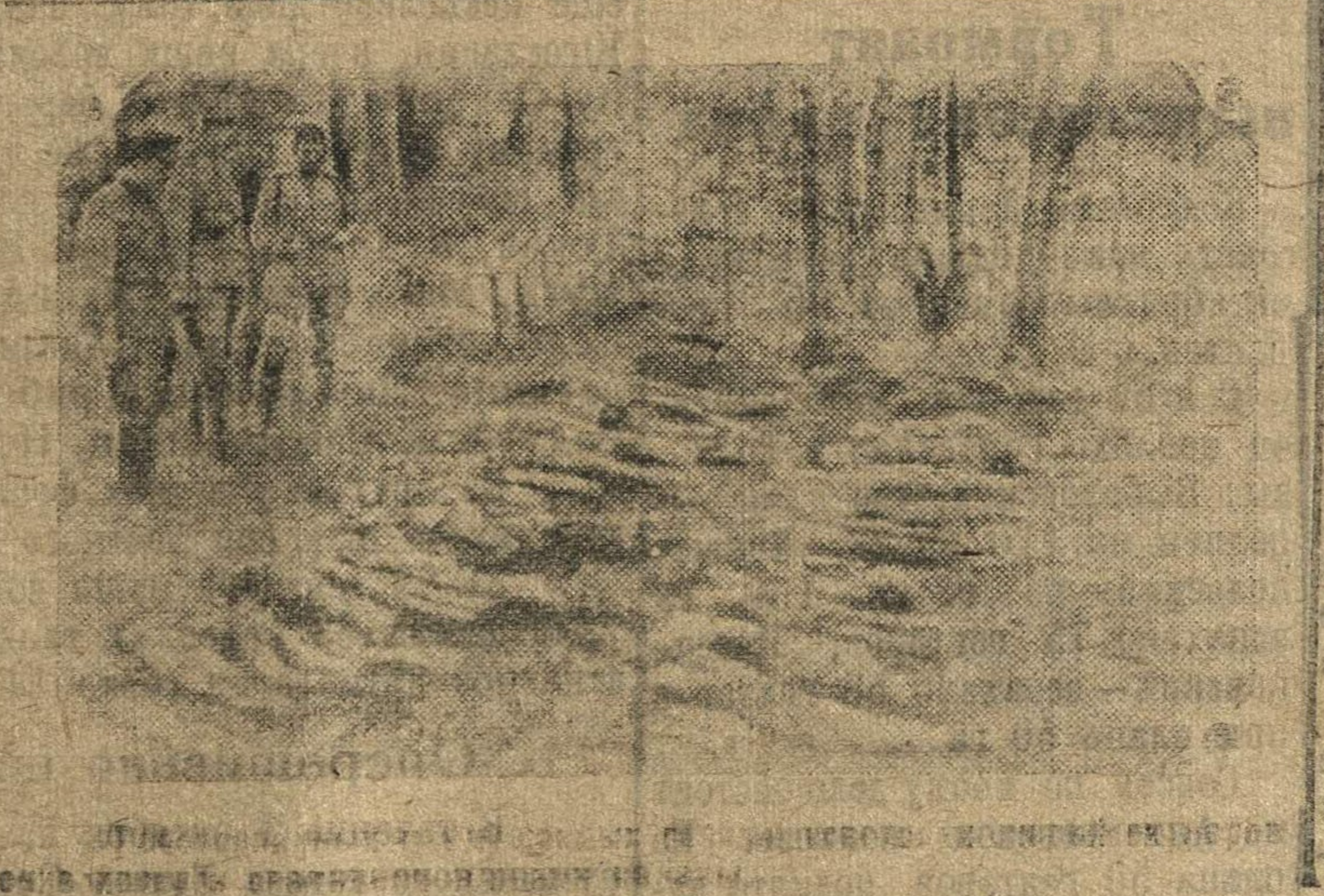
Лагерь смерти в Майданеке. Вид из окна крематория.