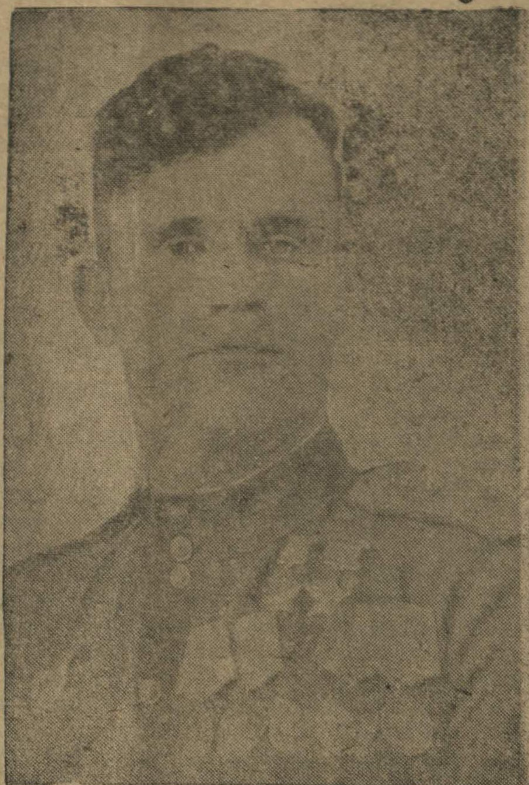
Дважды Герой Советского Союза гвардии капитан Николай Дмитриевич ГУЛЯЕВ. В боях с немецко-фашистскими захватчиками он лично сбил 57 вражеских самолетов. Тов. ГУЛЯЕВ уроженец станции Аксайская, Аксайского района, Ростовской области.

Председатель Верховного Совета СССР М. КАЛИНИН. Секретарь Президиума Верховного Совета СССР А. ГОРКИН. Москва, Кремль, 13 ноября 1944 г.