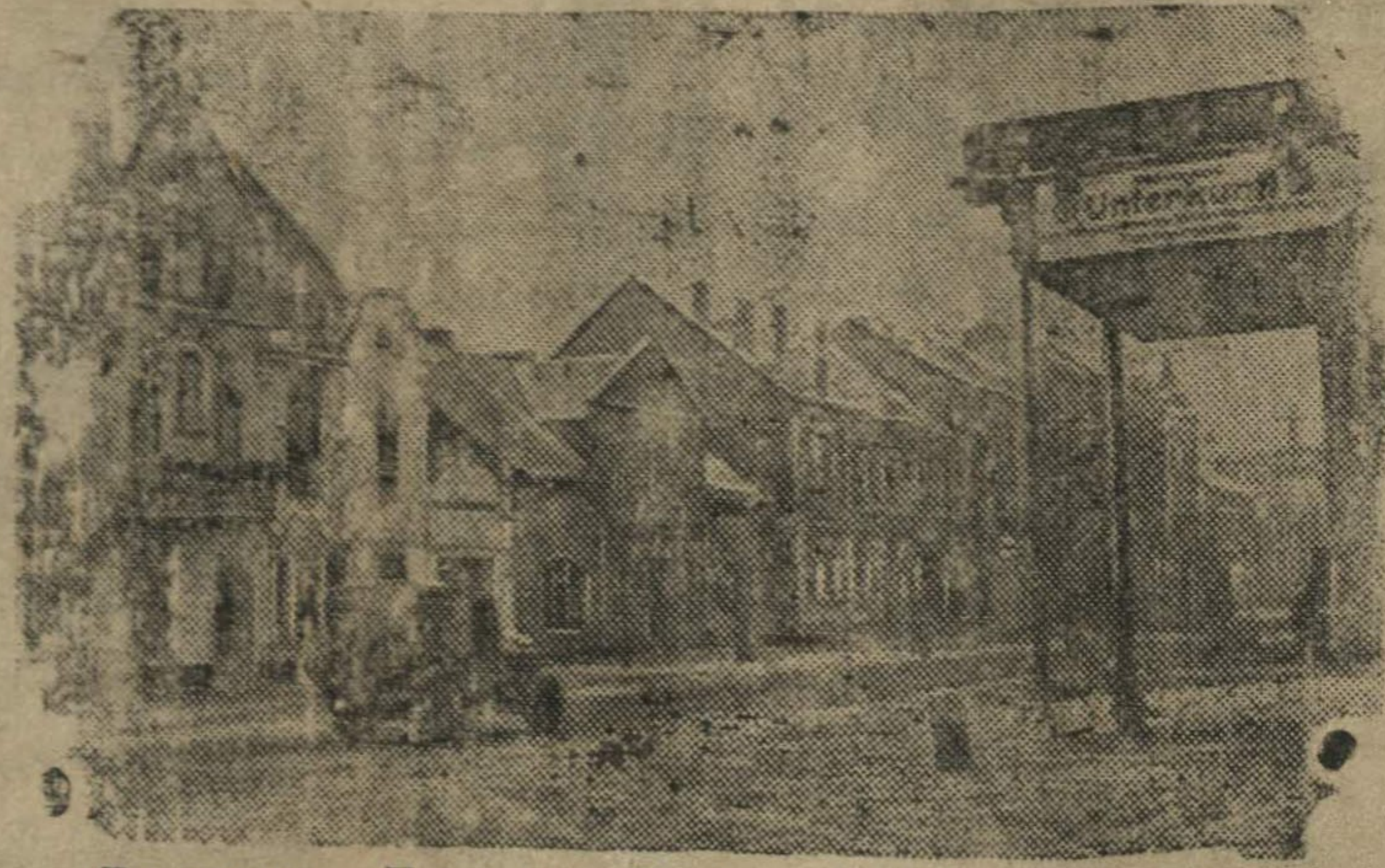
Восточная Пруссия. В городе Инстербург, занятом советскими войсками.