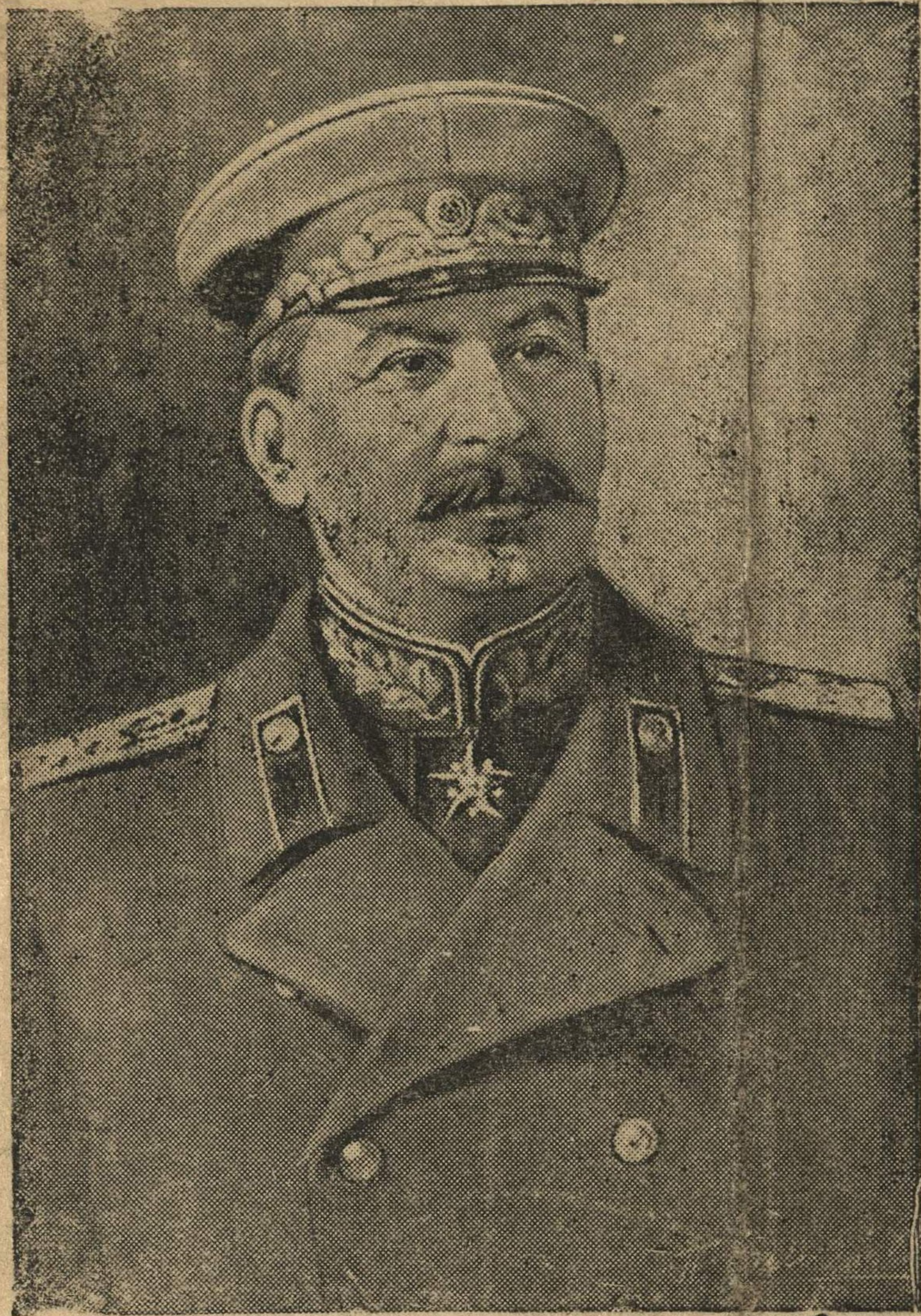
Верховный Главнокомандующий Маршал Советского Союза И. В. СТАЛИН.