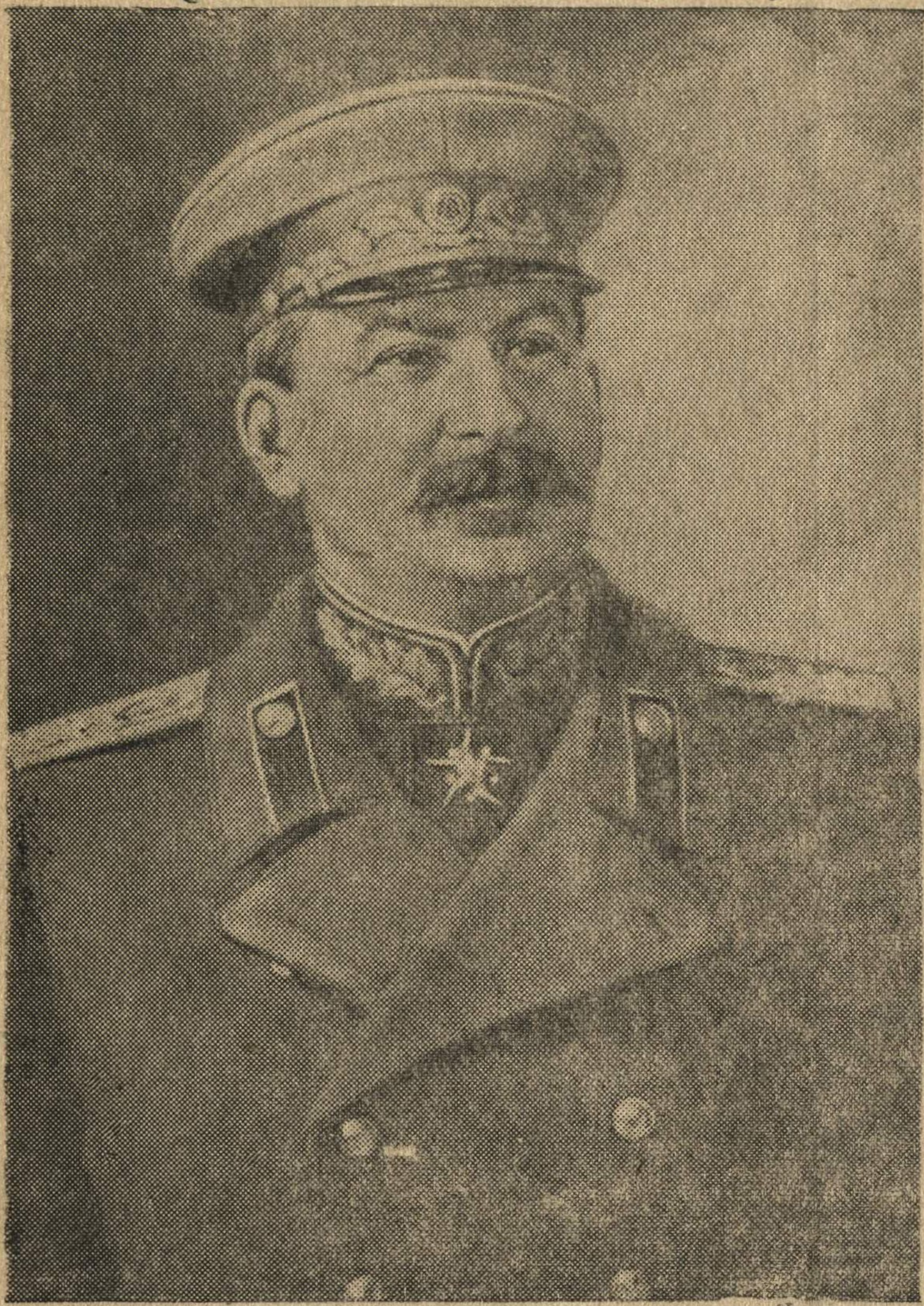
Верховный Главнокомандующий Маршал Советского Союза И. В. СТАЛИН