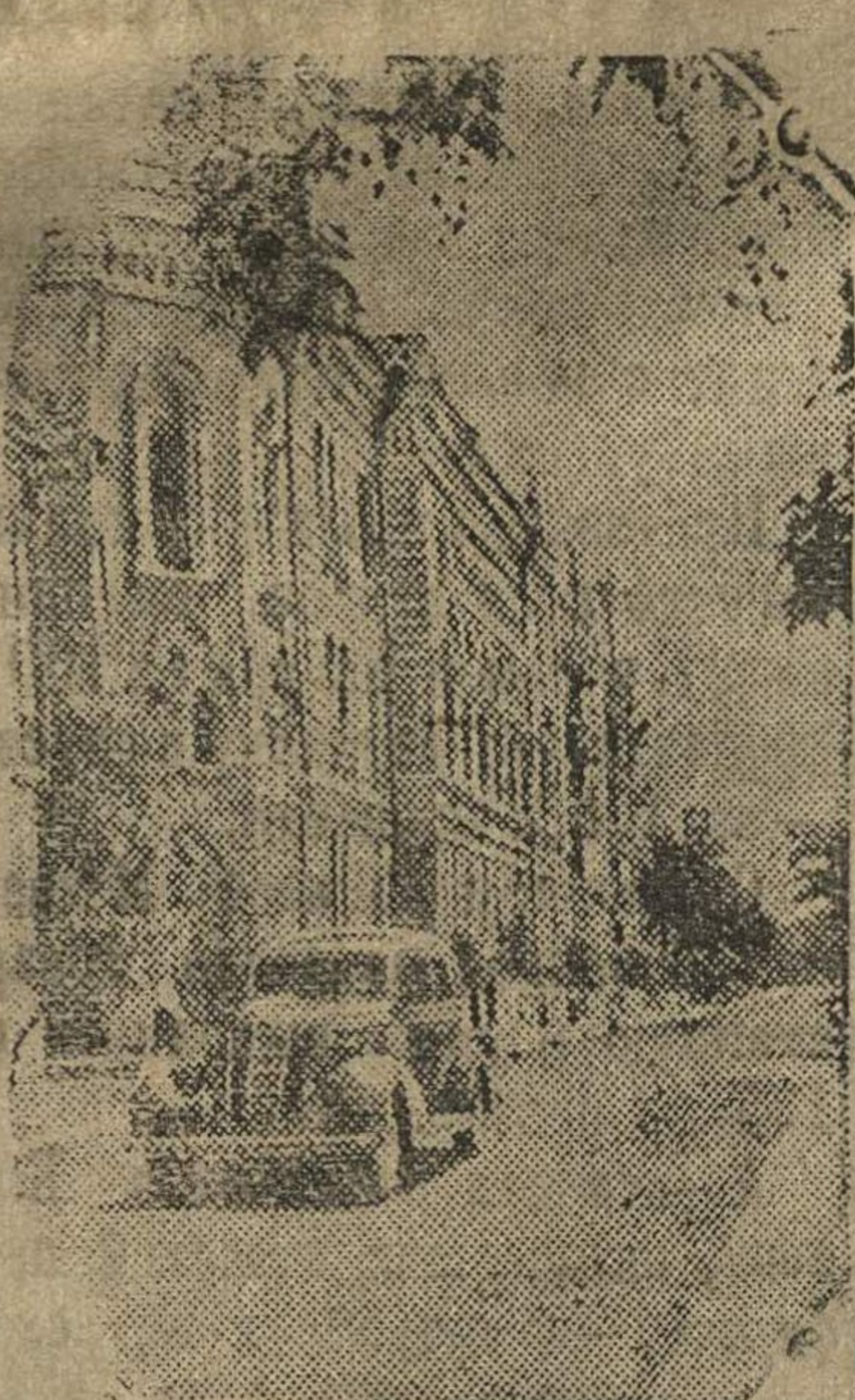
Школа им. Ленина на Советской улице в Астрахани.