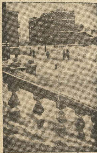
Зима в г. Магадане (Хабаровский край).