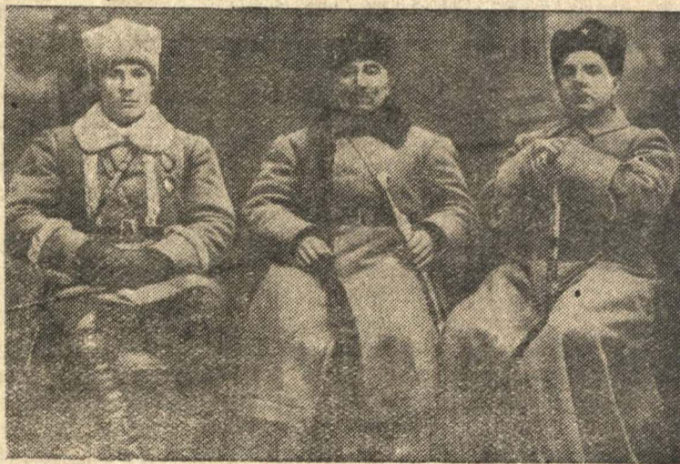
Т. т. К. Е. Ворошилов, С. М. Буленый и С. К. Тимошенко. (Снимок сделан в период гражданской войны).