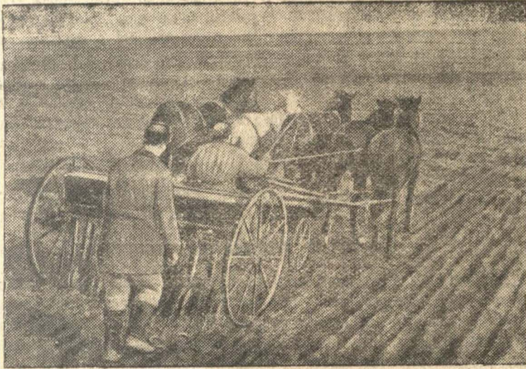
Сев ячменя конной сеялкой по культивированной зяби в колхозе „21-ый Октябрь“ (Симферопольский район).

В Крыму установилась теплая солнечная погода. Некоторые колхозы приступили к весенним полевым работам.