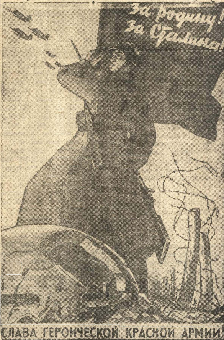
СЛАВА ГЕРОИЧЕСКОЙ КРАСНОЙ АРМИИ!

„Воин Красной Армии в плен не сдастся!“ Этот железный закон зародился в Красной Армии еще в годы гражданской войны. Доблестные бойцы бились до последнего дыхания, погибали в неравном бою, но живыми врагу не сдавались. Эта славная боевая традиция живет в нашей армии.