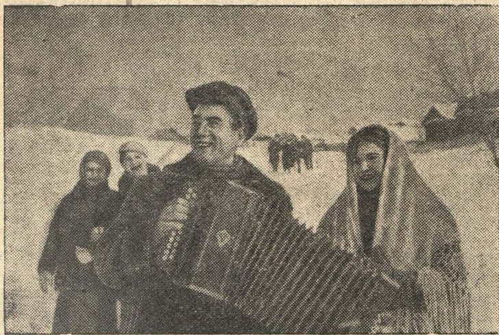
Колхозная молодежь направляется в клуб.

Зажиточно и культурно живут колхозники сельхозартели „Урожай“ (Чистопольский район, Татарская АССР). Колхозное село обогатилось благоустроенным клубом, избой-читальней, средней школой.