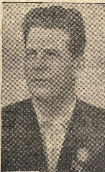
Первый секретарь ЦК КФ(б) Карело-Финской ССР Г. Н. Куприяев.