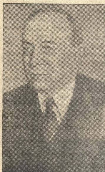
Председатель Президиума Верховного Совета Карело-Финской ССР О. В. Куусинен.