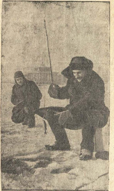
В выходной день на реке Волге у гор. Калинина.