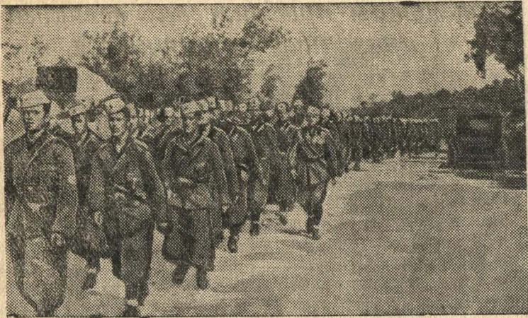
Итальянские войска в Албании.