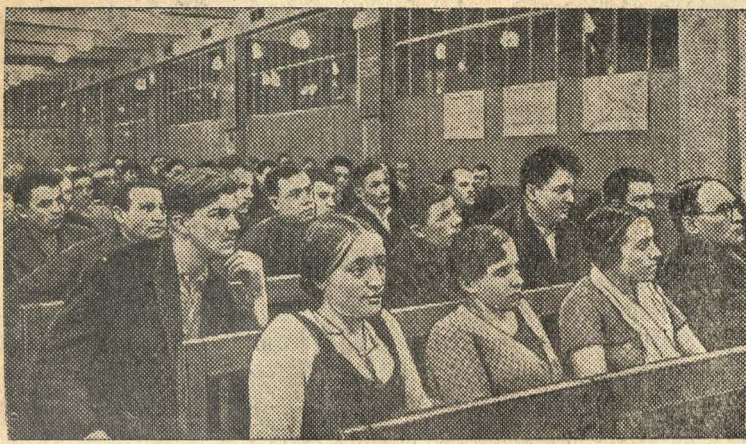
Партсобрание в литейном цехе № 3.

Отчетно-выборные собрания цеховых партийных организаций на заводе имени Сталина (Москва).