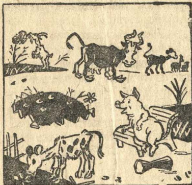
Сквер, разбитый „посетителями“