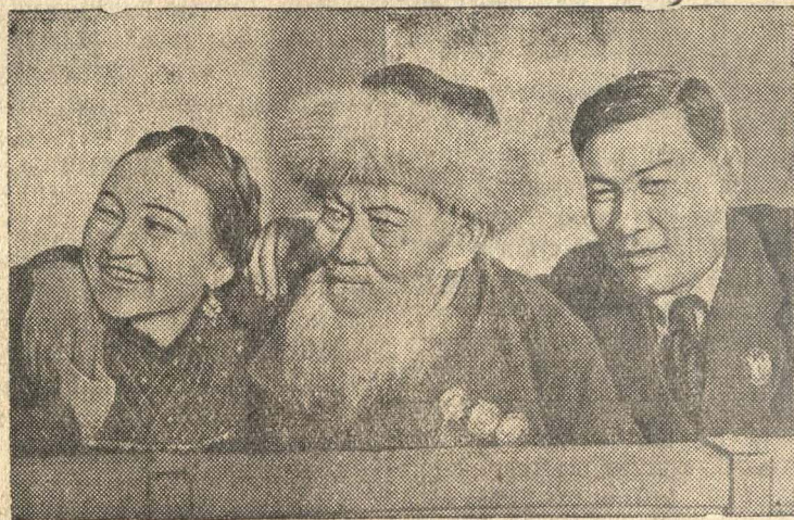
Лауреат Сталинской премии, трижды орденосеца Джамбул Джабаев (в центре), народная артистка СССР орденосеца Куляш Байсеитова и поэт орденосеца Т. Жароков.