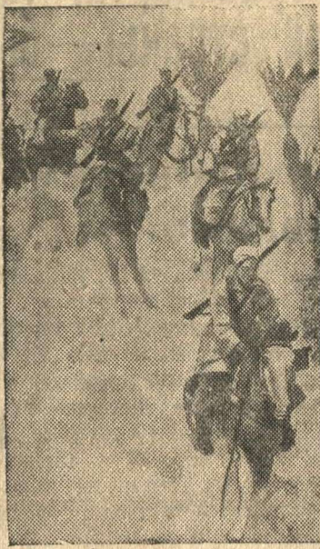
Туземная французская кавалерия генерала де Голля на фронте в Ливии.

В настоящее время Англия уделяет основное внимание усилению вооружения самолетов и увеличению численности военно-воздушных сил. Существующие типы бомбардировщиков снабжены новым, более мощным вооружением. Новые типы как бомбардировщиков, так и истребителей также имеют мощное вооружение. Английские самолеты снабжаются новыми или улучшенными типами моторов. Это мероприятие даст возможность снабдить их дополнительным вооружением или повысить грузоподъемность. С этой целью была проведена коренная реконструкция бомбардировщиков «Хэмпден», «Веллингтон» и «Уитли». Эти типы бомбардировщиков особенно широко использовались в первые 18 месяцев войны. Одновременно конструировались и сооружались новые типы более мощных бомбардировщиков,