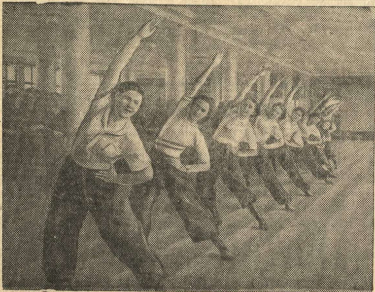
Группа девушек-комсомолок автозавода имени Сталина (Москва) выполняет гимнастические упражнения из комплекса ГТО.