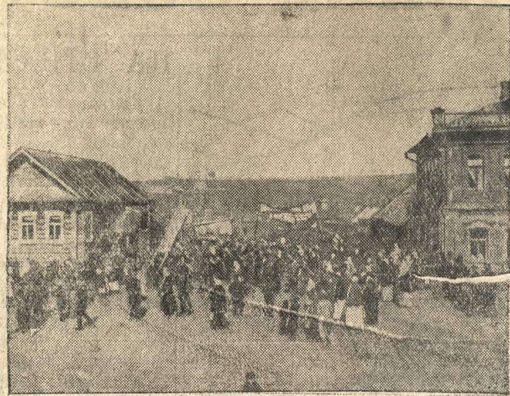
Демонстрация трудящихся Б-Мурашкина в Казачьей слободе в первый год советской власти.