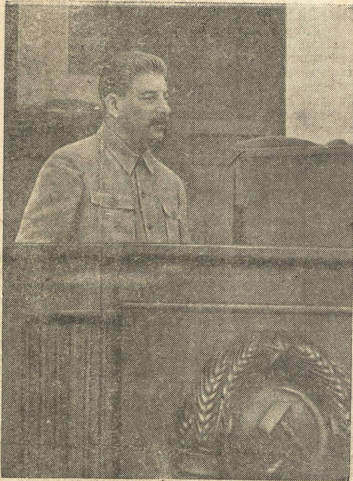
Выступление товарища И. В. Сталина на торжественном собрании, посвященном выпуску командиров, окончивших военные академии, состоявшемся в Большом Кремлевском дворце 5-го мая 1941 года.

Наш район соревнуется с Перевожским. По договору социалистического соревнования колхозники взяли на себя большие обязательства — добиться среднего урожая зерновых культур 14 центнеров с га. Весенний сев — исходный момент в борьбе за урожай. Посеять быстро и хорошо, наверстать упущенное время, быстрее ликвидировать разрыв между подготовкой почвы и севом, широко развернуть социалистическое соревнование в колхозах и тракторных бригадах — таковы задачи всех колхозов, партийных и комсомольских организаций, сельских советов, работников райзо и МТС, всех партийных и непартийных большевиков.