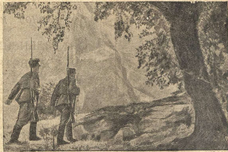
На Средне-Азиатской границе СССР.