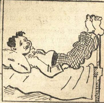
Грицю, Грицю до телят! В Гриця ноженьки болят...