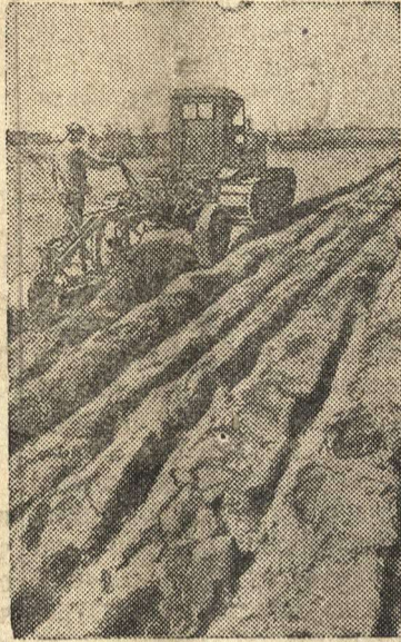
Трактор поднимает целину в Сигулдской волости Рижского уезда.

Сотни тракторов работают сейчас на полях Латвийской ССР.