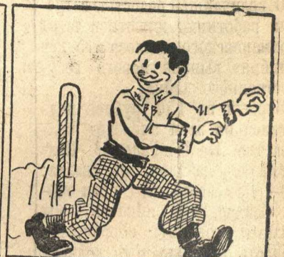
Грицю, Грицю до Маруси! „Зараз, зараз уберуся!“...