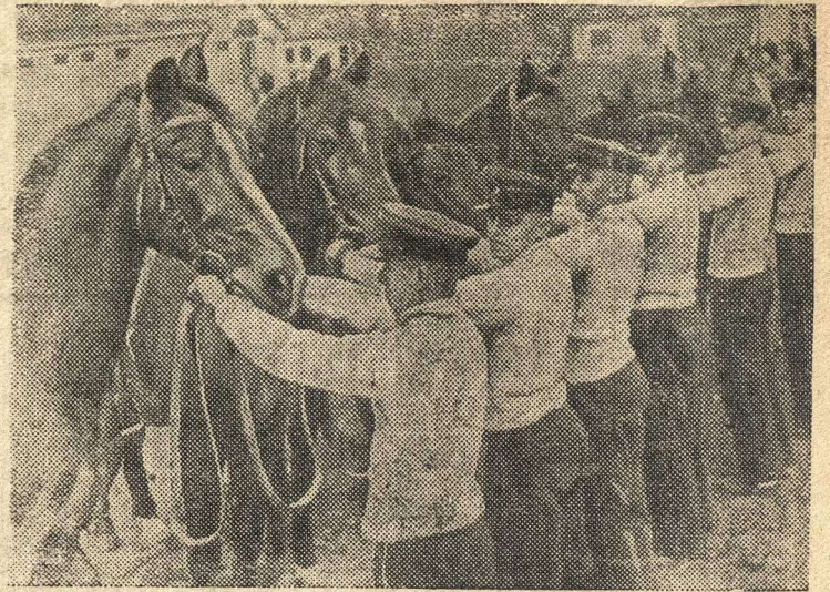
Группа курсантов-учеников 3-ей средней артиллерийской спецшколы.