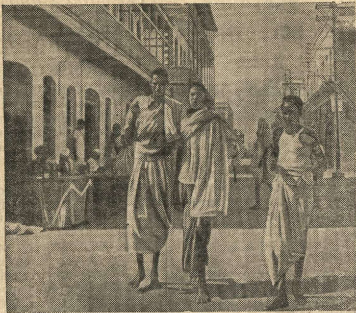
Улица в Джибути (Французское Сомали).