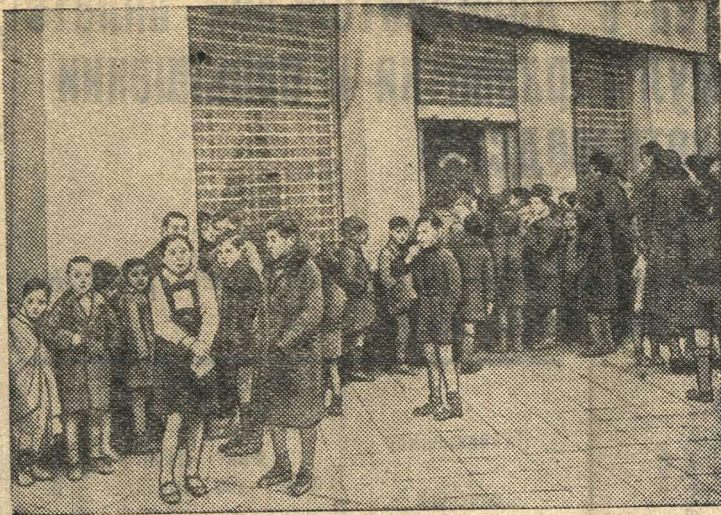
В ожидании очередного пайка в Испании.

Последние семь месяцев войны чрезвычайно затруднили связь британских доминионов с Англией. Это вызвало необходимость усиления военной промышленности самих колоний. Как сообщает «Нейсджер цейтунг», Институт тихоокеанских отношений в Сан-Франциско опубликовал обзор, содержащий данные о развитии этой промышленности. Уже 25 октября 1940 г. конференция в Дели (Индия), как известно, решила создать в Британской империи восточное Суэца «автаркический промышленный центр». Как сообщается в обзоре, конференция решила создать новые военно-промышленные зоны, чтобы сделать эту часть Британской империи в области военного производства менее зависимой от Англии. Центрами колониальной военной промышленности были намечены Индия и Австралия.