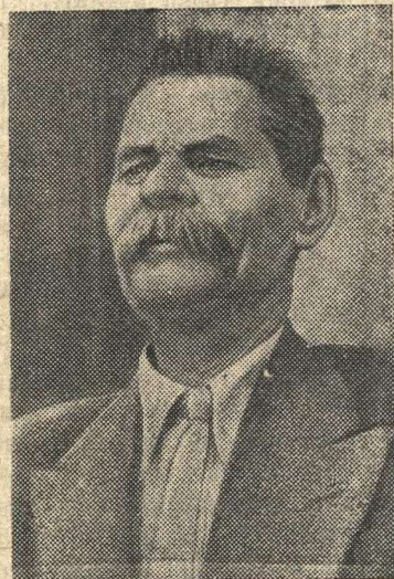
А. М. Горький (1934 г.) Репродукция с оригинала музея А. М. Горького

тельную пропаганду среди сормовских рабочих с целью возбудить их к революционному движению“.