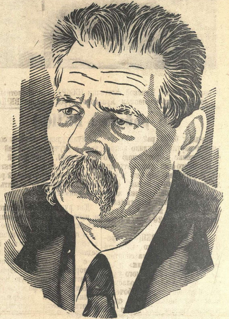
Алексей Максимович Горький.