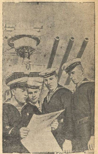
Один из лучших агитаторов на крейсере «Киров» (Краснознаменный Балтийский флот) коммунист Л. И. Шацких читает газету краснофлотцам.