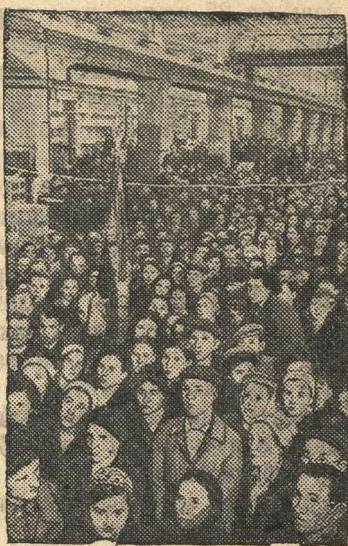
Митинг на Московском заводе «Динамо» имени Кирова в связи с заявлением заместителя Председателя Совнаркома СССР и Народного Комиссара иностранных дел тов. В. М. МОЛОТОВА