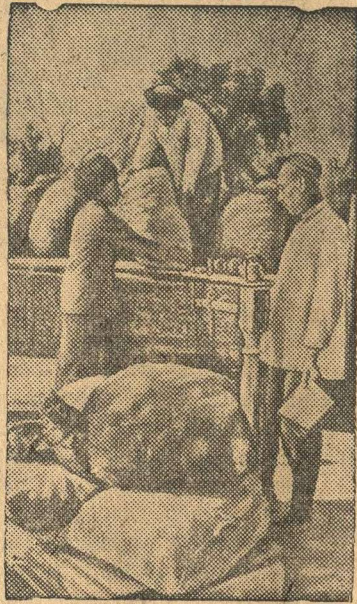
Отгрузка картофеля нового урожая для сдачи государству.

В ответ на наглое нападение фашистских захватчиков колхозники сельхозартели имени Калинина (аул Геокча, Апхабадский район) досрочно выполняют поставки государству.