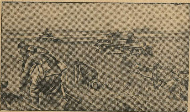
Боевая учеба в Красной Армии. ЗА ТАНКАМИ.