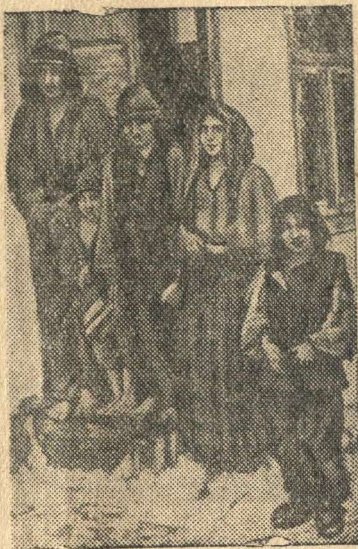
Доведенная до крайней нищеты румынская семья.