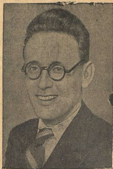
Абсолютный чемпион СССР по шахматам гроссмейстер М. М. Ботвинник.