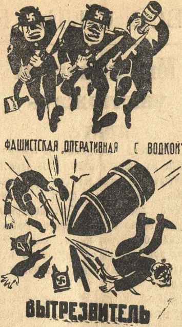
ФАШИСТСКАЯ ОПЕРАТИВНАЯ С ВОДКОЙ

Правительство не может верить тому, что германское правительство будет действительно соблюдать правила Гаагской Конвенции 1907 года. Советское Правительство уже заявляло протест против имевших место, вопреки элементарным принципам международного права, обстрелов со стороны германской армии советских госпиталей. Ввиду этого Советское правительство имеет все основания подозревать, что германское правительство постановления Гаагской конвенции соблюдать не будет и что госпитальные суда будут им использованы в военных целях. Ввиду изложенного, Советское Правительство не может согласиться на применение в отношении этих судов режима, предусмотренного Гаагской конвенцией от 18 октября 1907 года.