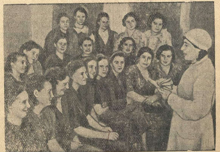
Будущие доноры в зале регистрации, перед медицинским обследованием.

Каждый день в Институт переливания крови (Москва) являются работницы, домохозяйки, учащиеся и жены мобилизованных в Красную Армию с просьбой записать их в доноры.