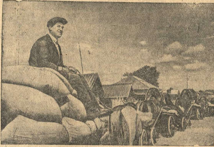
Красный обоз колхоза «Красный Урал». За один день колхоз сдал 104 центнера высококачественного зерна.

Желая всеми силами помочь фронту, колхозники Сухоложья (Свердловская обл.) досрочно выполняют свои обязательства перед государством. Ежедневно на пункты Заготзерно прибывают красные обозы с хлебом.